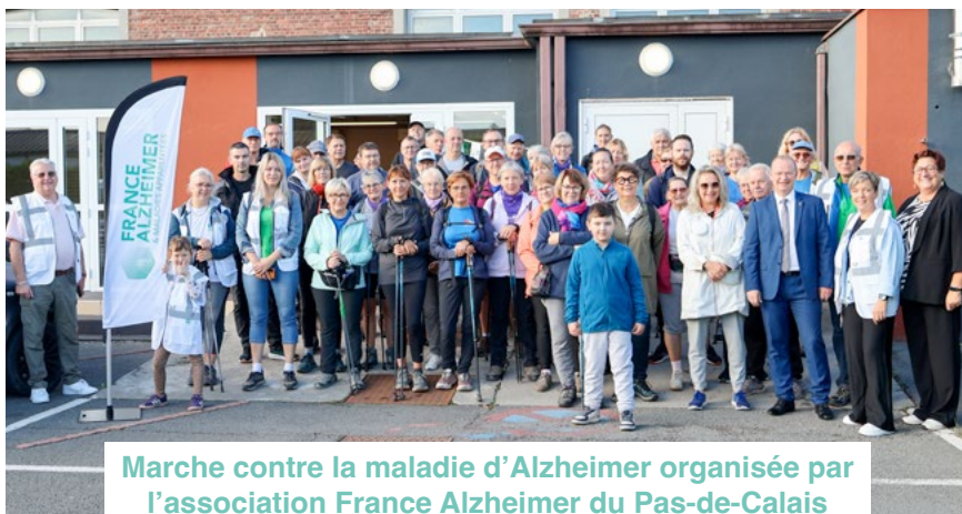
Marche contre la maladie d'Alzheimer organisée par l'association France Alzheimer du Pas-de-Calais