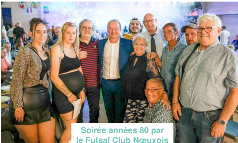
Soirée années 80 par le Futsal Club Nœuxois