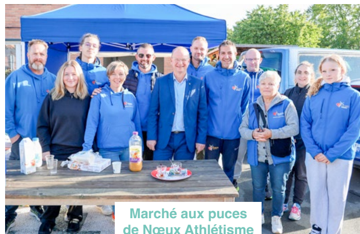
Marché aux puces de Nœux Athlétisme