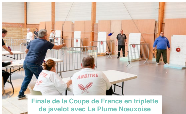
Finale de la Coupe de France en triplète de javelot avec La Plume Nœuxoise