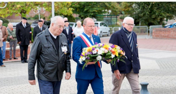
Cérémonie commémorative pour la Journée Nationale d'hommage aux Harkis