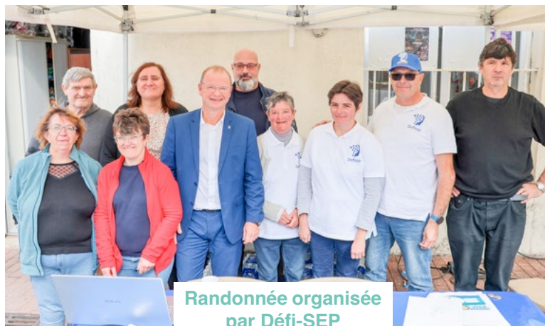
Randonnée organisée par Défi-SEP