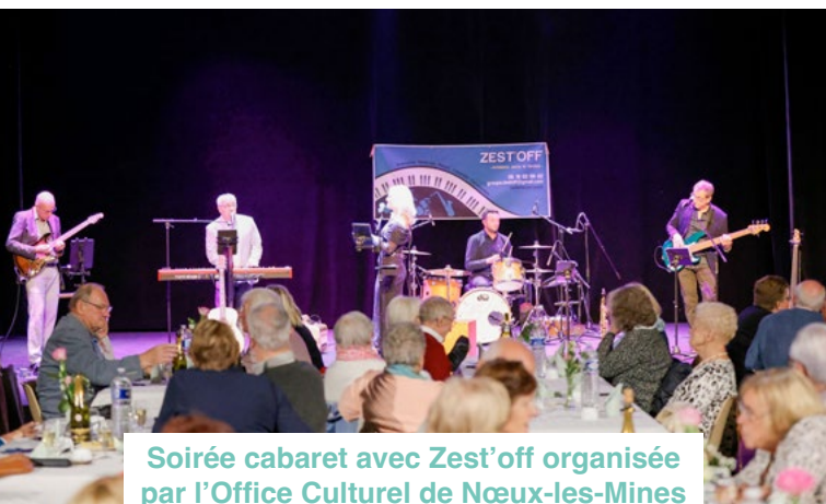
Soirée cabaret avec Zest'off organisée par l'Office Culturel de Nœux-les-Mines