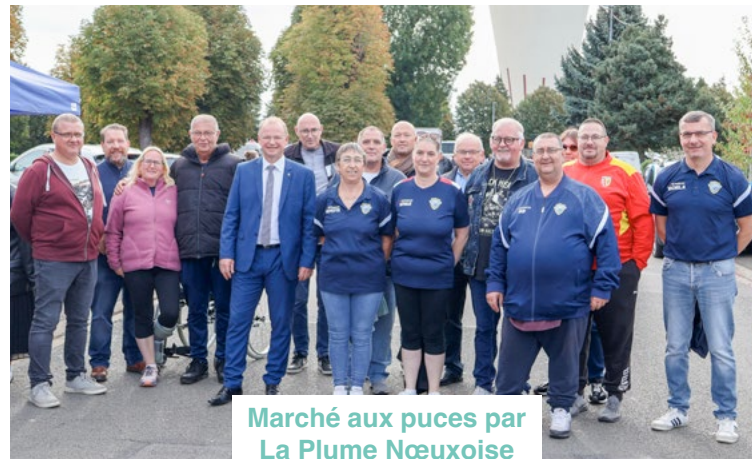
Marché aux puces par La Plume Nœuxoise