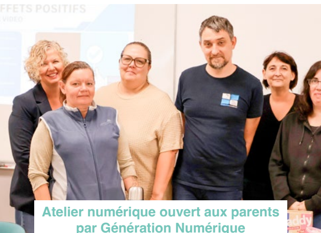
Atelier numérique ouvert aux parents par Génération Numérique