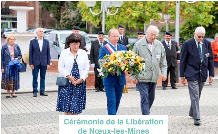
Cérémonie de la Libération de Nœux-les-Mines