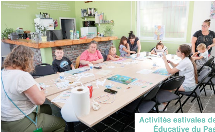
Activités estivales de l'Association d'Action Éducative du Pas-de-Calais (AAE62)