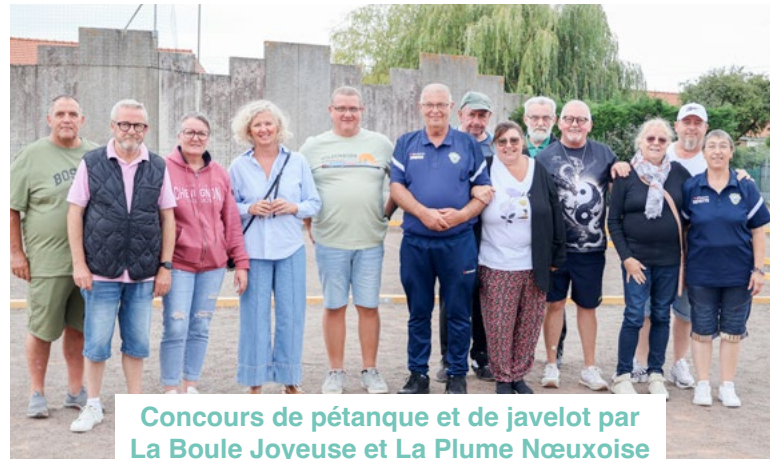
Concours de pétanque et de javelot par La Boule Joyeuse et La Plume Nœuxoise