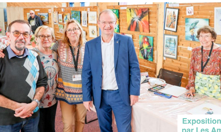
Exposition automnale par Les Amis des Arts