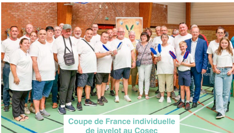
Coupe de France individuelle de javelot au Coséc