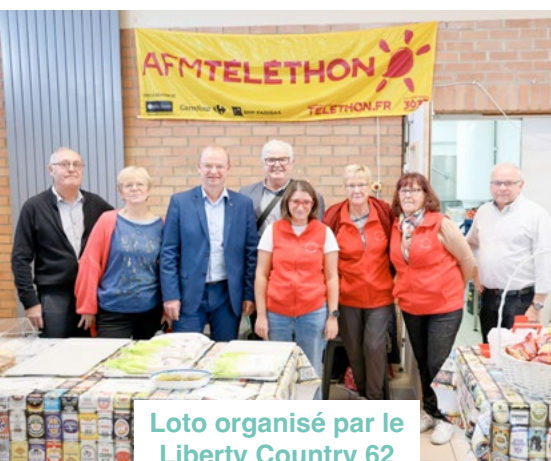
Loto organisé par le Liberty Country 62