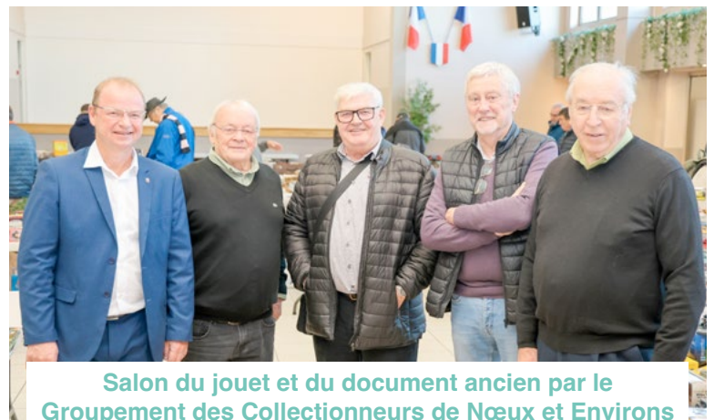
Salon du jouet et du document ancien par le Groupement des Collectionneurs de Nœux et Environs