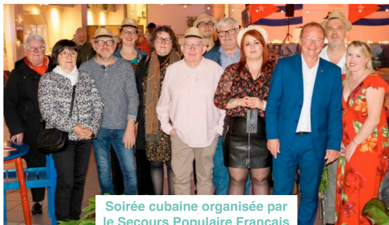
Soirée cubaine organisée par le Secours Populaire Français