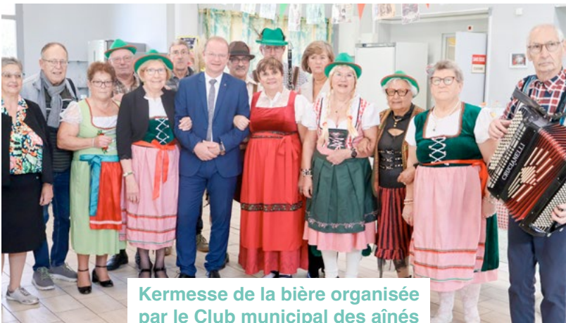
Kermesse de la bière organisée par le Club municipal des aînés