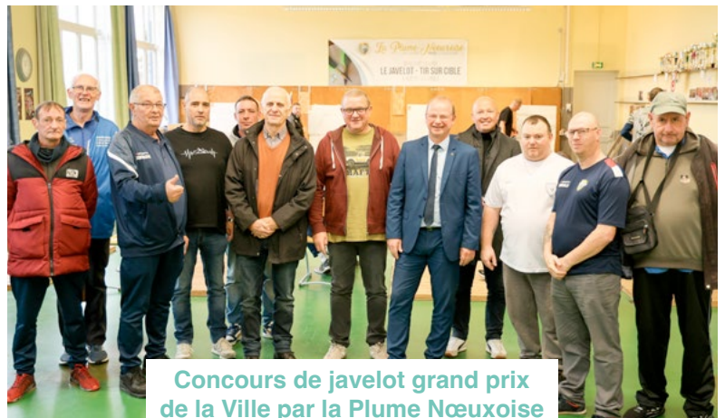
Concours de javélot grand prix de la Ville par la Plume Nœuxoise