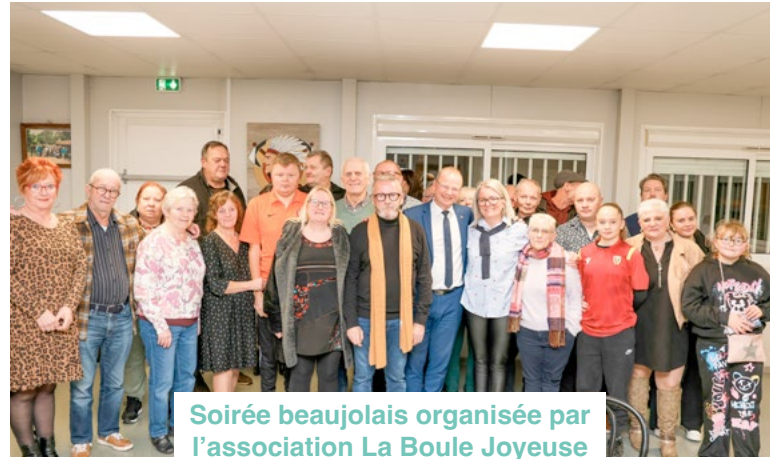
Soirée beaujolais organisée par l'association La Boule Joyeuse