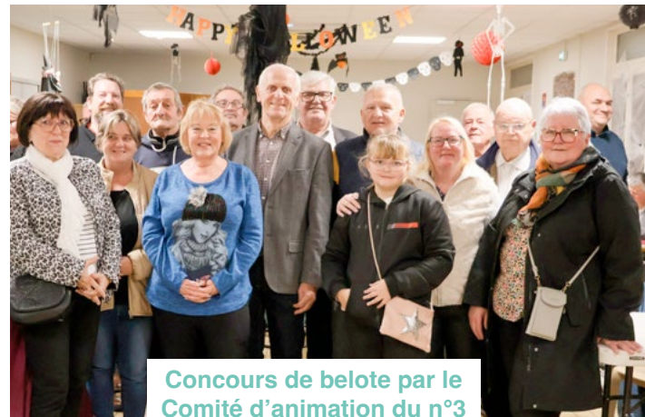
Concours de belote par le Comité d'animation du n°3