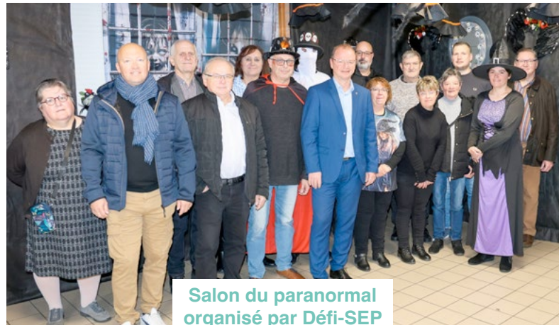
Salon du paranormal organisé par Défi-SEP