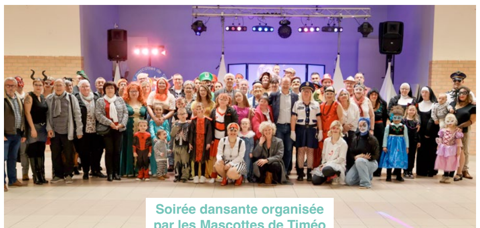
Soirée dansante organisée par les Mascottes de Timéo