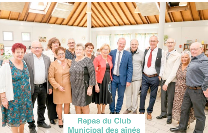
Repas du Club Municipal des aînés