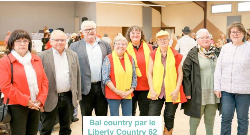
Bal country par le Liberty Country 62