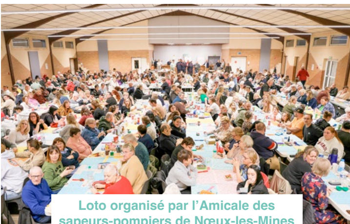
Loto organisé par l'Amicale des sapeurs-pompiers de Nœux-les-Mines