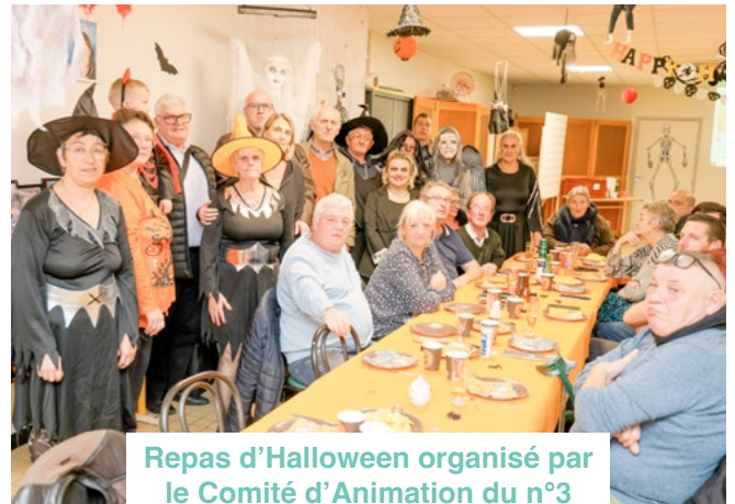
Repas d'Halloween organisé par le Comité d'Animation du n°3