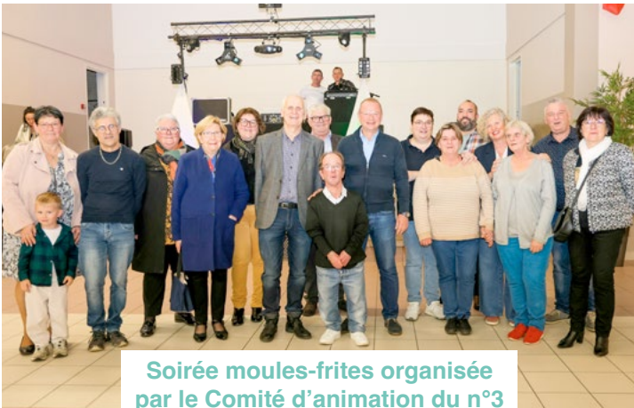
Soirée moules-frites organisée par le Comité d'animation du n°3