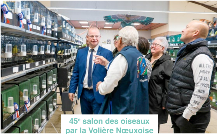
45 e salon des oiseaux par la Volière Nœuxoise