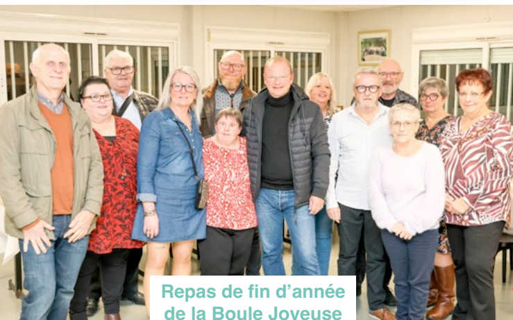
Repas de fin d'année de la Boule Joyeuse