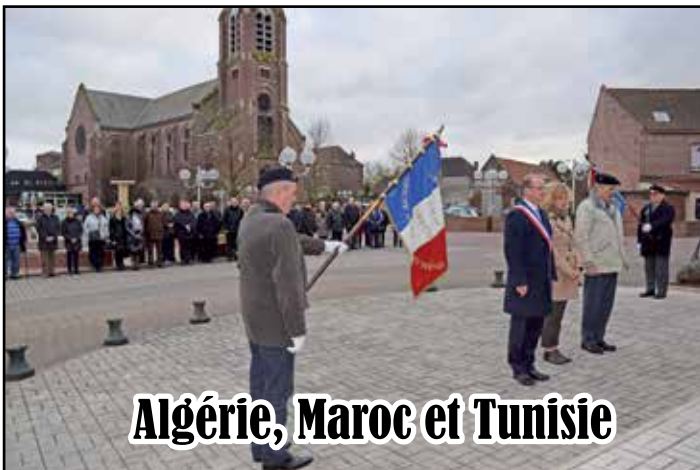
Algérie, Maroc et Tunisie