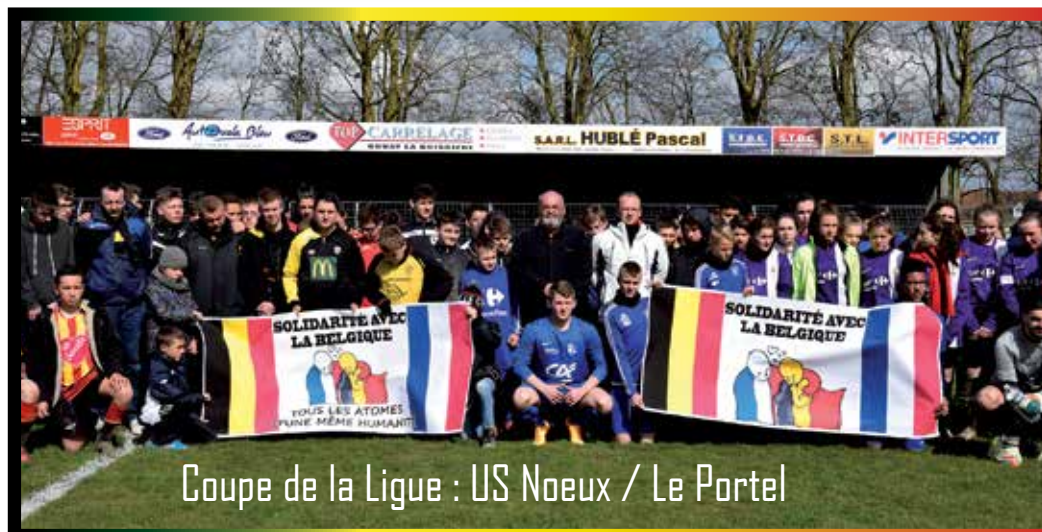
Coupe de la Ligue : US Noeux / Le Portel

C'est Monsieur le Maire qui a lancé le match, qui a vu le Stade Portelois l'emporter aux tirs au but.