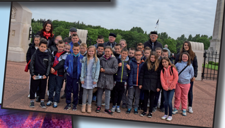
Visite de Notre Dame de Lorette avec les Gardes → d'Honneur