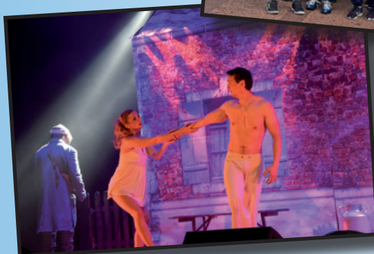
← La Comédie Musicale «La Fiancée du Poilu»