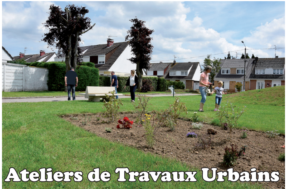
Ateliers de Travaux Urbains

Coût des travaux : 29 802, 36 € 1/3 Ville, 1/3 Région, 1/3 État ( CGET)