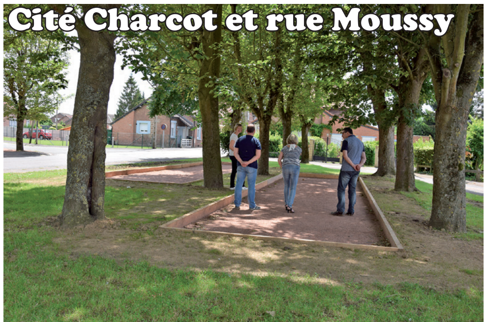
Cité Charcot et rue Moussy