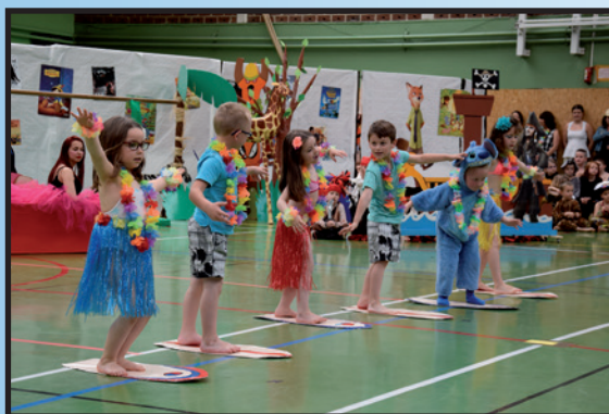
← Kermesse et fête de l'école Jean Moulin