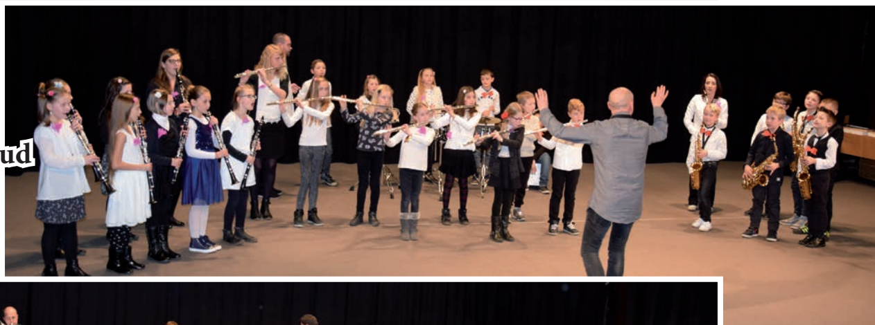
École Louis Pergaud