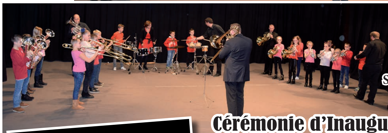
École St Éxupéry