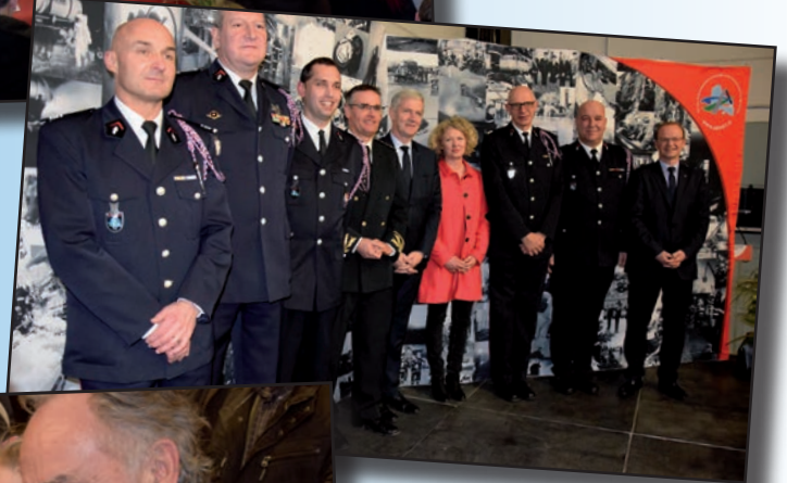
Passation de commandement au Centre de Secours →