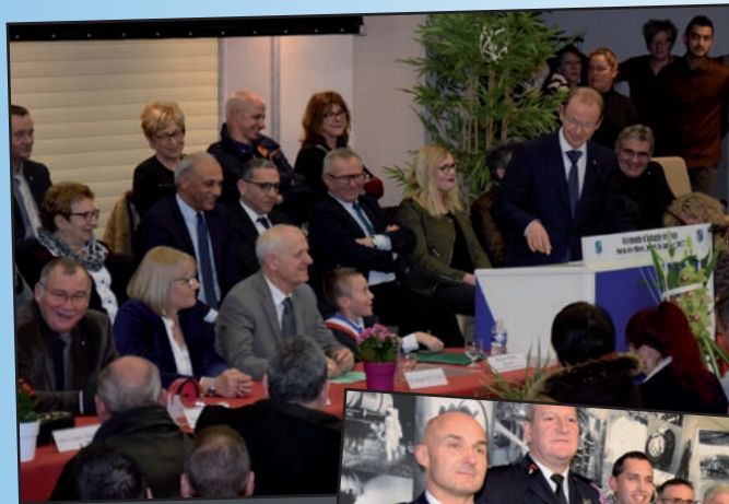
← Cérémonie des Vœux du Maire