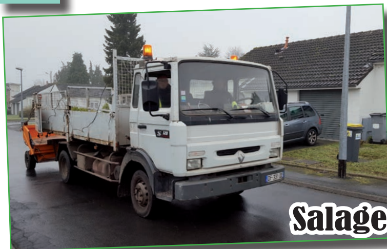
Salage en ville

Dès les premières gelées le personnel technique communal était sur le terrain pour saler, et ainsi sécuriser les routes et les trottoirs.