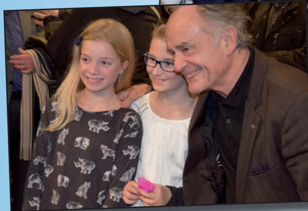
← Inauguration Orchestre A l'École