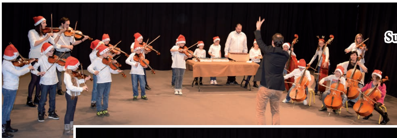
École Suzanne Blin