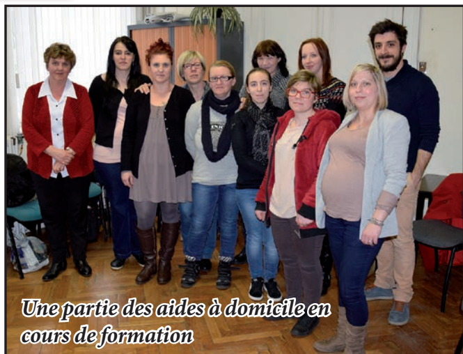
Une partie des aides à domicile en cours de formation

Les auxiliaires de vie et les aides à domicile du CCAS ont bénéficié d'une formation visant à se tenir informé du matériel médical disponible actuellement sur le marché.