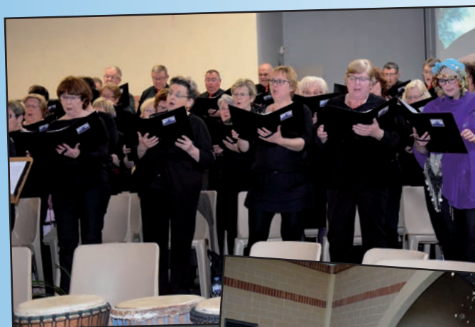
← Concert de Printemps avec Vox Cantabile et l'Orchestre d'Harmonie