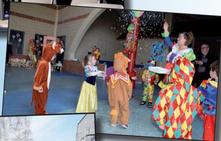
→ Carnaval chez les P'tites Frimousses