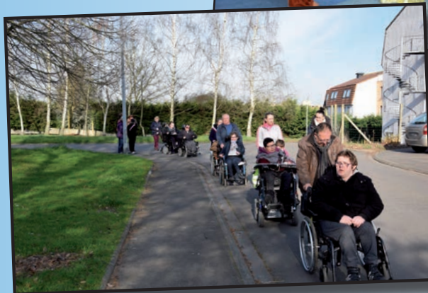
← Parcours du Cœur avec les résidents de l'APF et les associations nœuxoises