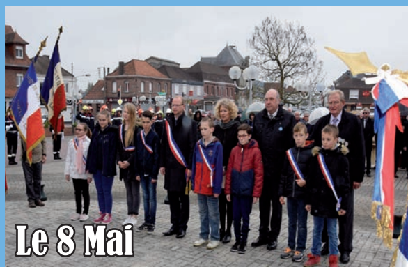
Le 8 Mai

Après un défilé et un dépôt de gerbes au Monument aux Morts de la Place Jean Jaurès, des médailles Argent, Vermeil, Or et Grand Or ont été remises lors de la cérémonie du 1 er Mai, après les traditionnelles revendications des syndicats.