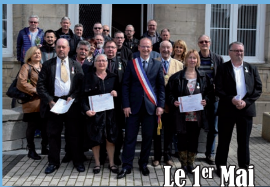
Le 1 er Mai