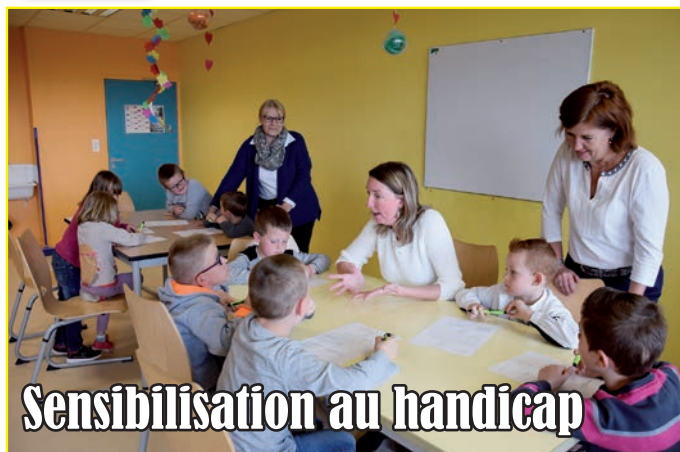
Sensibilisation au handicap

Dans le cadre des travaux de la Charte Handicap portés par la Communauté d'Agglomération, les enfants de l'accueil de loisirs ont bénéficié, durant les dernières vacances scolaires, d'une animation de sensibilisation au handicap.