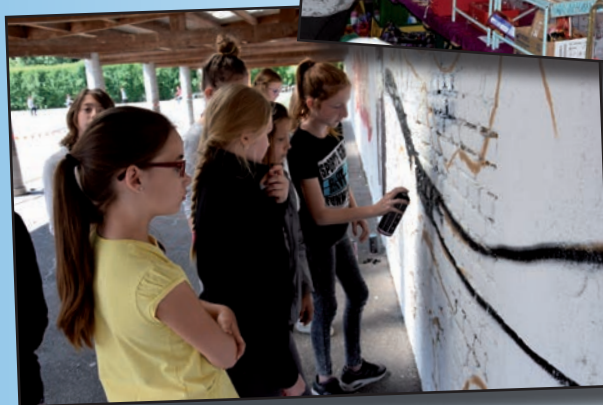
← Fresques dans les écoles avec le CMJ

Depuis le 27 avril 2015, une nouvelle association de commerçants s'est créée dans notre ville.