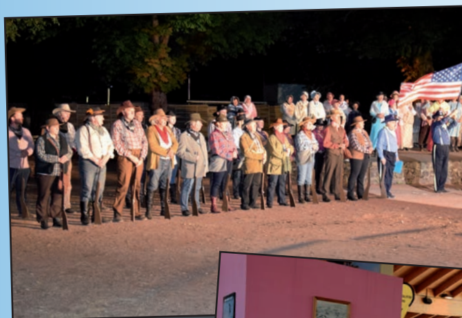
← Son et Lumière «Buffalo Bill»