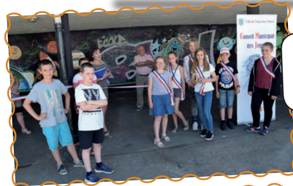
Inaugurations des projets du CMJ