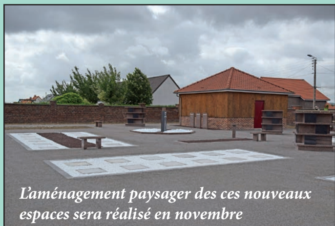
L'aménagement paysager des ces nouveaux espaces sera réalisé en novembre