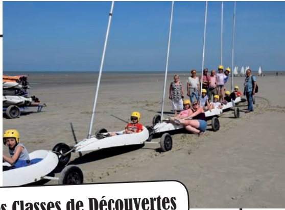
Deuxième Session des Classes de Découvertes