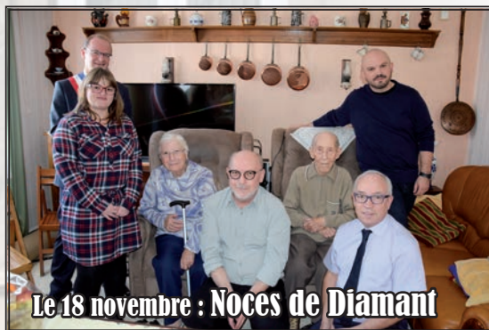
Le 18 novembre : Noces de Diamant