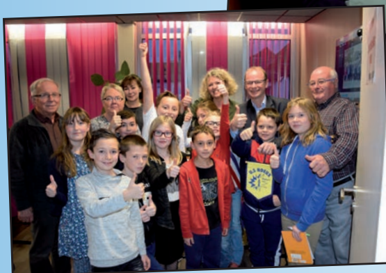
⇐ NOUVEAU CONSEIL MUNICIPAL DES JEUNES