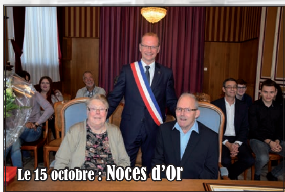
Le 15 octobre : Noces d'Or