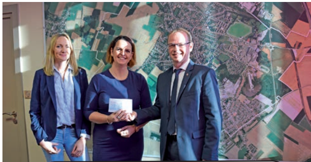
Prêt d'Honneur pour une entreprise locale