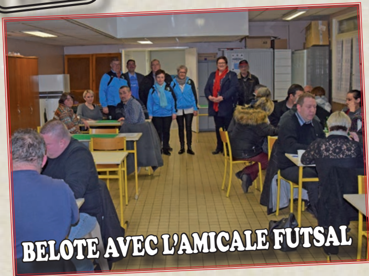
BELOTE AVEC L'AMICALE FUTSAL