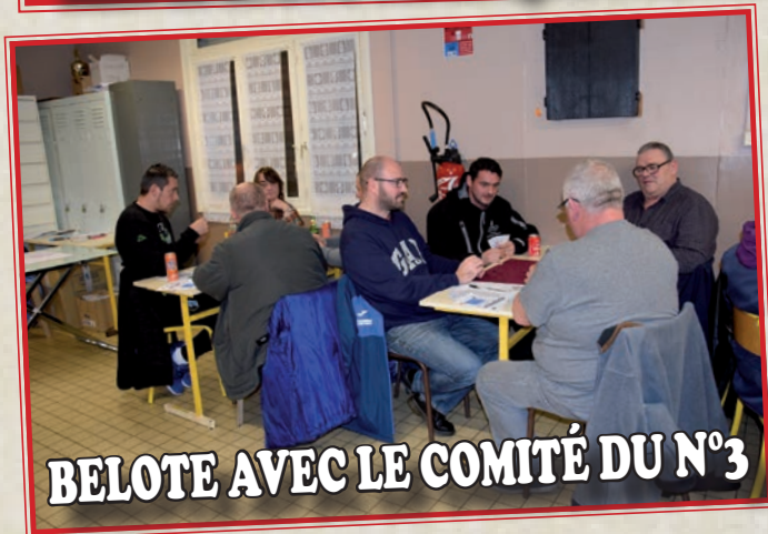
BELOTE AVEC LE COMITÉ DU N°3

Afin de créer une dynamique entre les quartiers et les différentes associations, mais également afin de passer une soirée conviviale, des tournois de belote sont fréquemment organisés, comme dernièrement avec le Comité du N°3, l'Olympique Nœuxois ou l'Amicale Futsal Club Nœuxois.