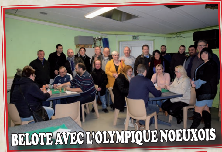
BELOTE AVEC L'OLYMPIQUE NOEUXOIS

Afin de créer une dynamique entre les quartiers et les différentes associations, mais également afin de passer une soirée conviviale, des tournois de belote sont fréquemment organisés, comme dernièrement avec le Comité du N°3, l'Olympique Nœuxois ou l'Amicale Futsal Club Nœuxois.