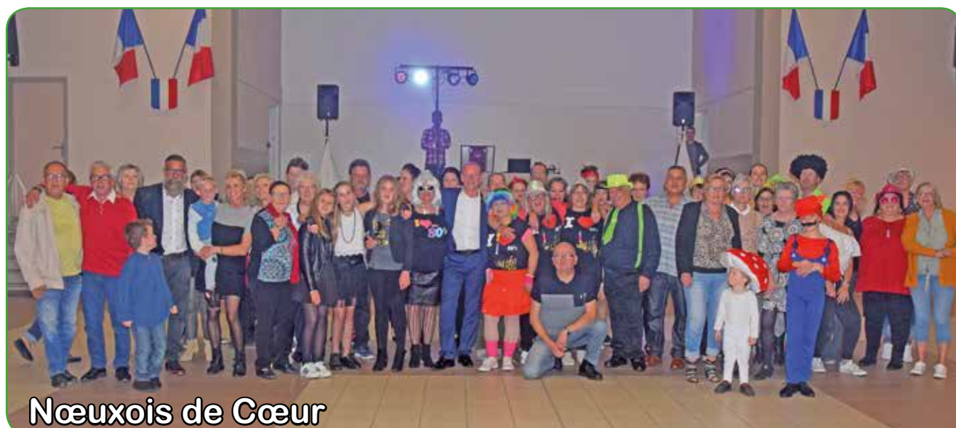
Nœuxois de Cœur

Plus de 120 invités étaient présents lors de la soirée organisée par l'association Nœuxois de Cœur le 6 octobre. Certains convives ont redoublé d'originalité pour participer au concours du plus beau déguisement initié pour l'occasion.