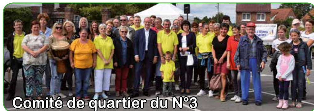
Comité de quartier du N°3

Marché aux puces, spectacle de chants, djembé, batucada, javelots et jeux pour enfants, tel était le programme de la fête de quartier organisée par le Comité d'Animation du N°3, le 8 septembre dernier.