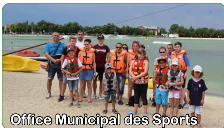
Office Municipal des Sports

Une dizaine d'enfants ont profité de cette action et pratiqué canoë, pédalo et mini-golf.