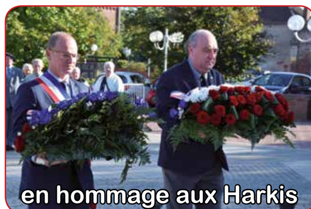
en hommage aux Harkis