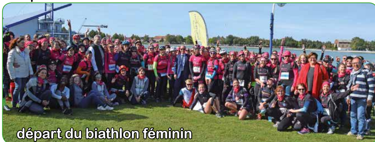
départ du biathlon féminin

Sous un soleil radieux, la Fête du Sport, couplée avec le Forum des Associations, fut une belle réussite les 29 et 30 septembre sur la base nautique de Loisinord.