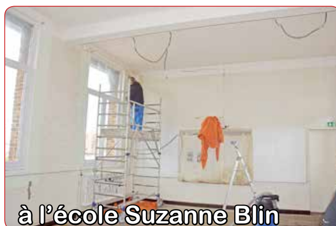
à l'école Suzanne Blin

Les sols seront, quant à eux, remplacés si nécessaire lors des prochaines vacances de décembre.