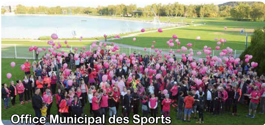
Office Municipal des Sports

Plus de 500 personnes se sont mobilisées, et, vêtues de rose pour l'occasion, ont chaussé leurs baskets. Félicitations à tous !