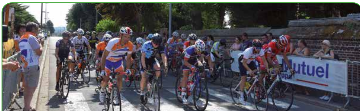
Grand Prix Le Vincennes

Ils étaient 23 au départ de la seconde édition de la course «le Vincennes», organisée le 4 août par le VCN.