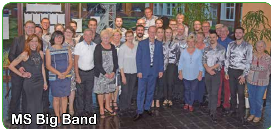
MS Big Band

La salle Brassens affichait complet le 22 septembre dernier lors de la soirée cabaret, organisée par l'Office Culturel.