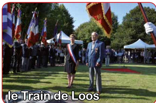
le Train de Loos

Les recueils étaient solennels lors des cérémonies patriotiques de la Libération de Nœux le 8 septembre et le 25 septembre pour l'hommage aux Harkis.