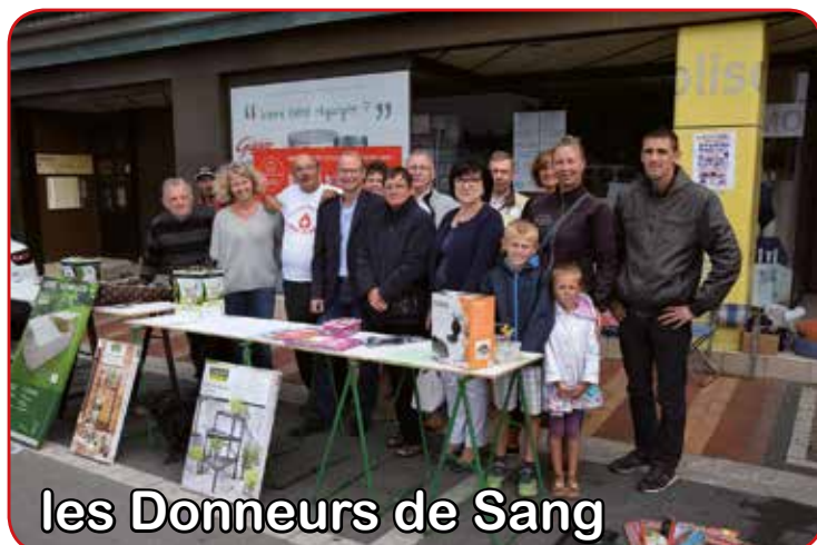
les Donneurs de Sang

Faire du shopping à ciel ouvert, tel est le but de la traditionnelle braderie de rentrée organisée par la municipalité.