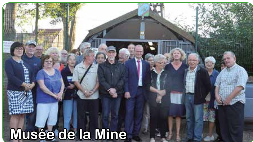
Musée de la Mine