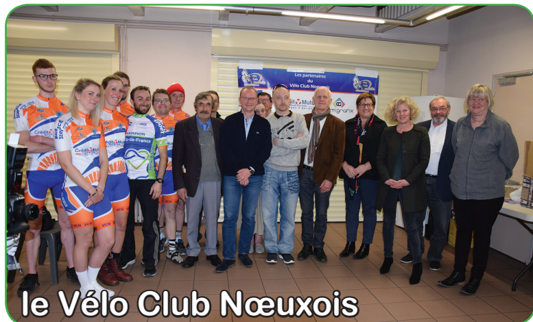
le Vélo Club Nœuxois