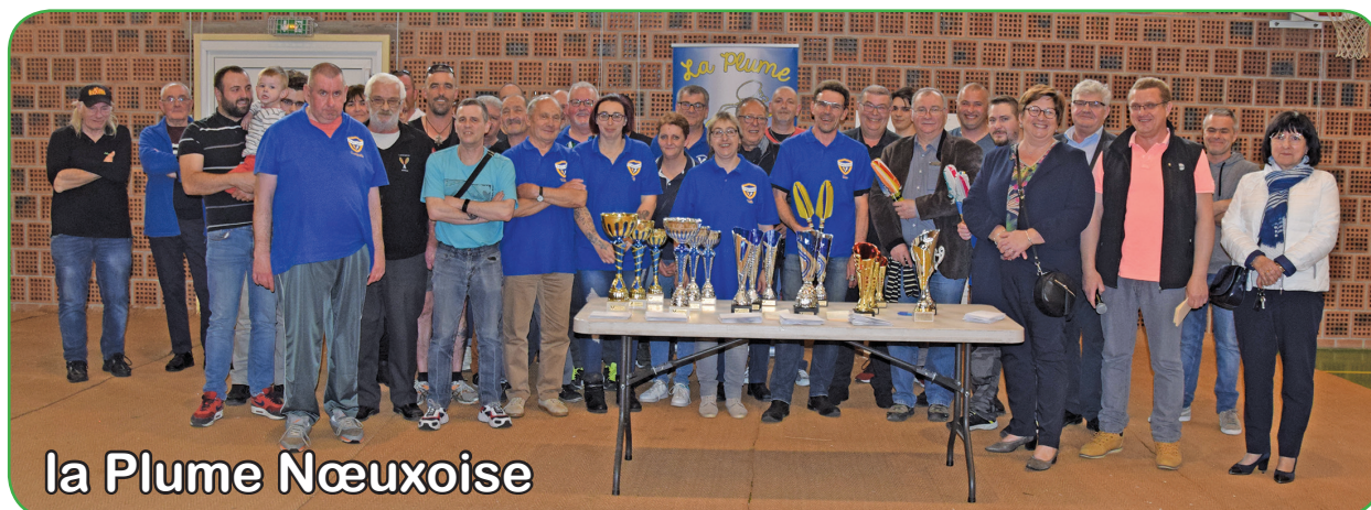
la Plume Nœuxoise

Ce grand Prix de la Ville de javelot, organisé les 30 et 31 mars salle Maistre, était une première pour le tout nouveau club «la Plume Nœuxoise».