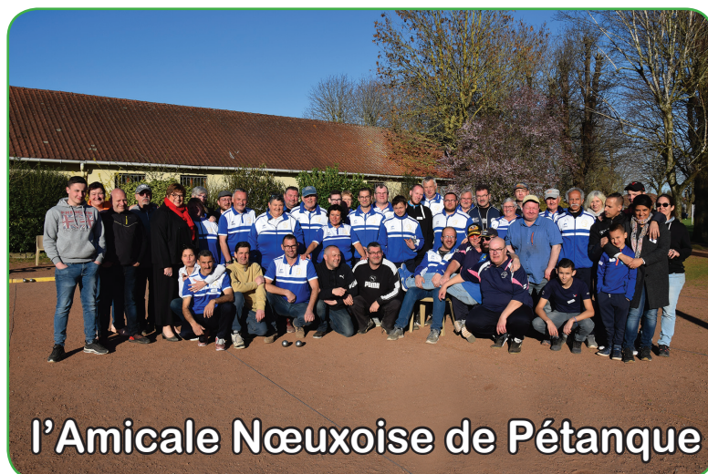
l'Amicale Nœuxoise de Pétanque

46 joueurs se sont donc affrontés, dans la bonne humeur, et ce sont finalement les boulistes Tadao qui sont repartis avec le trophée. Celui-ci sera remis en jeu chaque année.