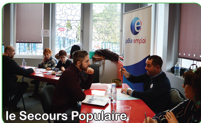
le Secours Populaire

Organisé le 12 mars par le Secours Populaire, en partenariat avec Interinser de Béthune, le Job Dating Insertion a connu une belle affluence.