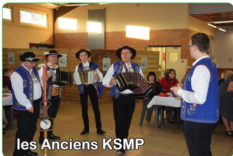
les Anciens KSMP

La salle était comble et l'ambiance festive et familiale lors du repas polonais des Anciens KSMP, le dimanche 10 mars à la salle Mendès France.