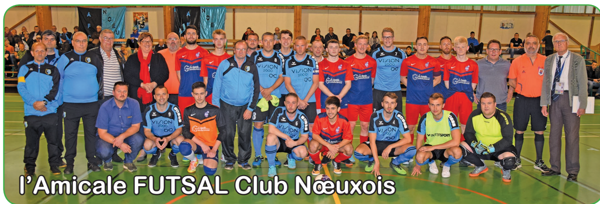
l'Amicale FUTSAL Club Nœuxois

L'Amicale Futsal a organisé, le vendredi 17 mai dans la salle du Cossec, la demi-finale de la Coupe d'Artois.