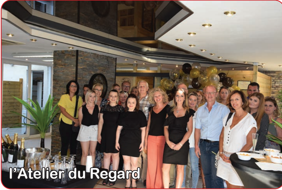
l'Atelier du Regard

Le Beauty Spa s'est agrandi pour ouvrir, au 125 rue Nationale, l'Atelier du Regard.