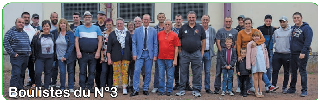
Boulistes du N°3

22 équipes étaient engagées lors du tournoi amical de pétanque organisé par l'Amicale Futsal, sur le terrain de la salle Maistre.