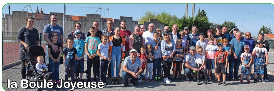
la Boule Joyeuse