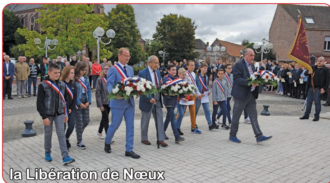
la Libération de Nœux

Le samedi 7 septembre, élus, membres des associations patriotiques et anonymes sont venus assister à la cérémonie d'hommage de la Libération de Nœux.