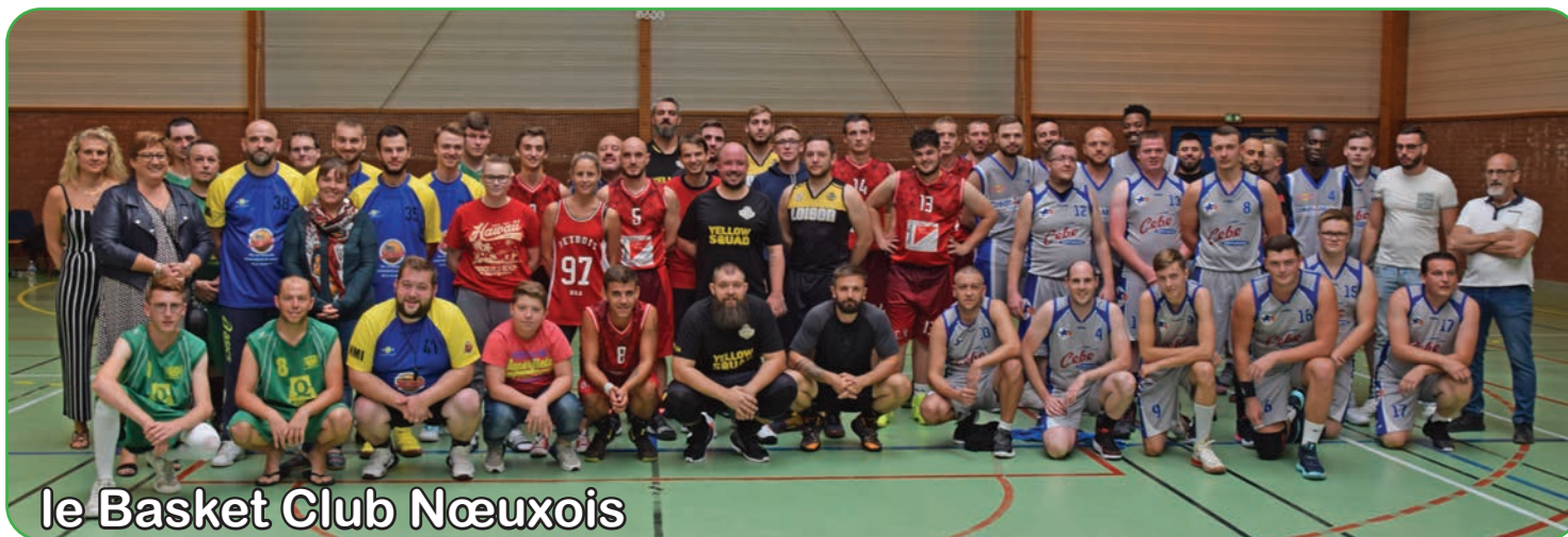
le Basket Club Nœuxois