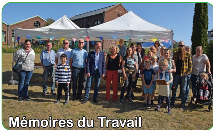
Mémoires du Travail