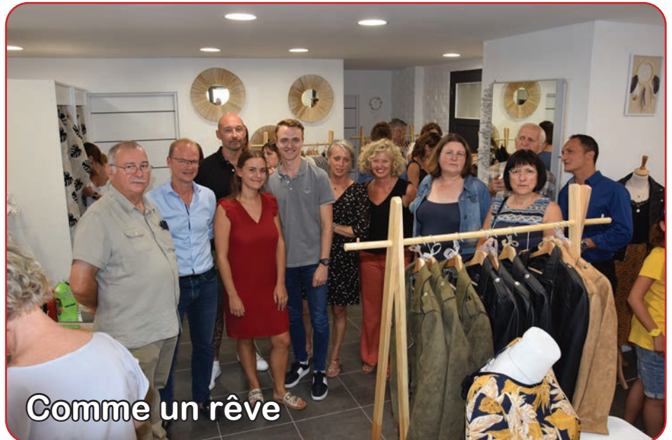
Comme un rêve