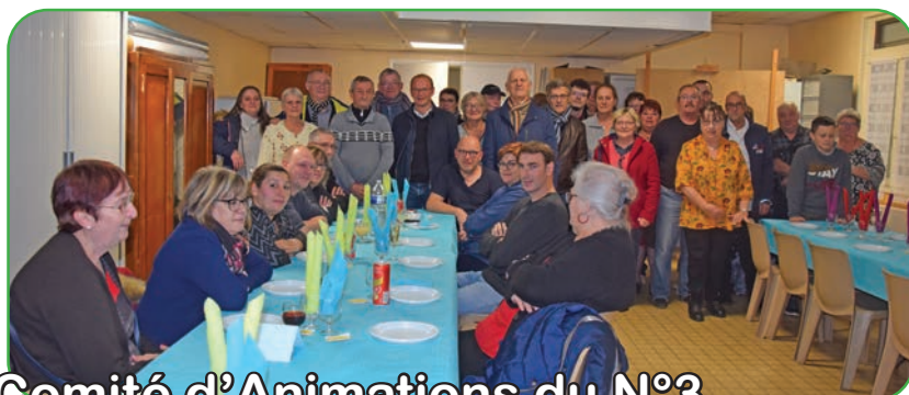
Comité d'Animations du N°3

Une trentaine de personnes, issues des associations voisines, telles que la Boule Joyeuse, l'US Nœux, l'Olympique Nœuxois ou la Plume Nœuxoise, étaient inscrites pour participer à ce moment de jeu et d'échange.