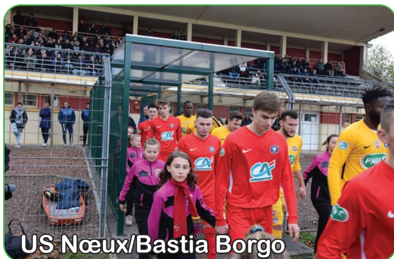
US Nœux/Bastia Borgo

Félicitations aux joueurs pour être parvenus jusqu'à ce niveau de compétition.