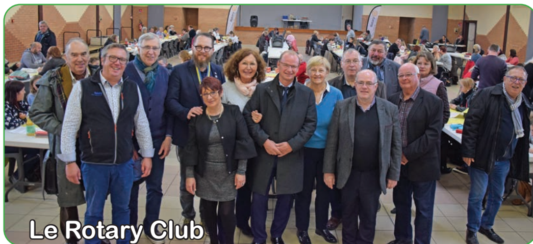
Le Rotary Club

Est-ce l'attrait du jeu, l'appât du gain ou le fait de savoir que les bénéfices sont reversés aux personnes défavorisées de la commune? Toujours est-il que le traditionnel loto du Rotary Nœux Soleil de l'Artois a attiré près de 200 personnes, début novembre salle Mendès France.