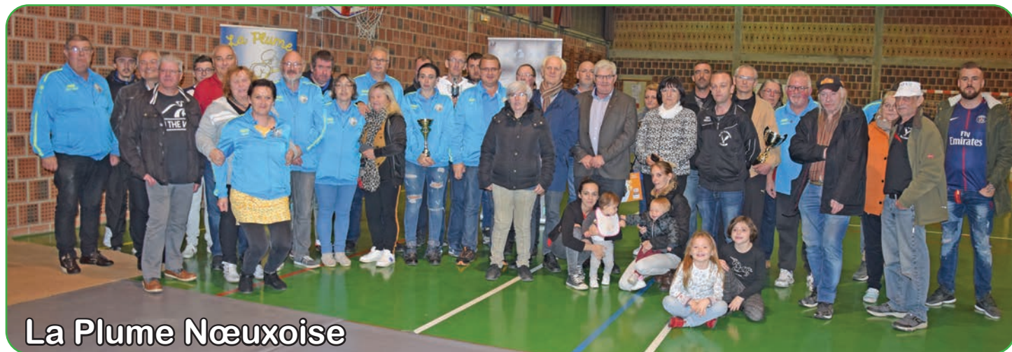
La Plume Nœuxoise

Une vingtaine d'équipes étaient engagées lors du tournoi organisé par la Plume Nœuxoise à la salle Maistre.