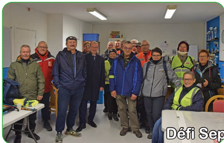
Défi Sep Nœux