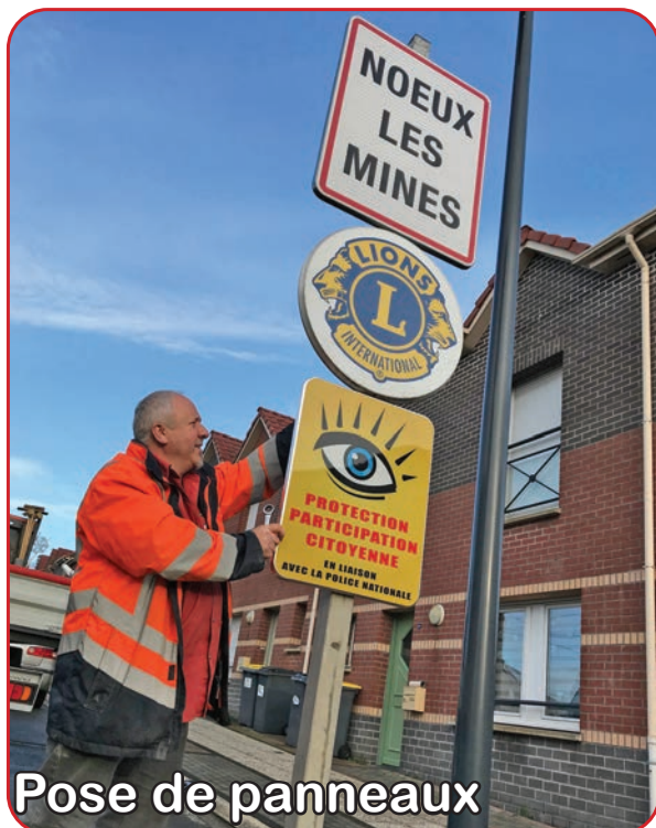
Pose de panneaux

Dans le cadre du dispositif «Participation Citoyenne», signé en octobre en mairie par le sous-préfet de l'arrondissement de Béthune, par Monsieur le Maire et par le commandant de Police de Nœux-Barlin, des panneaux ont été installés par les services techniques aux entrées de ville.