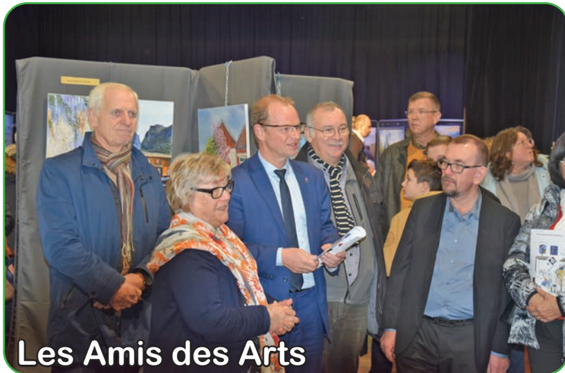
Les Amis des Arts

Le vendredi 15 novembre, le Centre Brassens accueillait la 61 ème exposition des Amis des Arts.