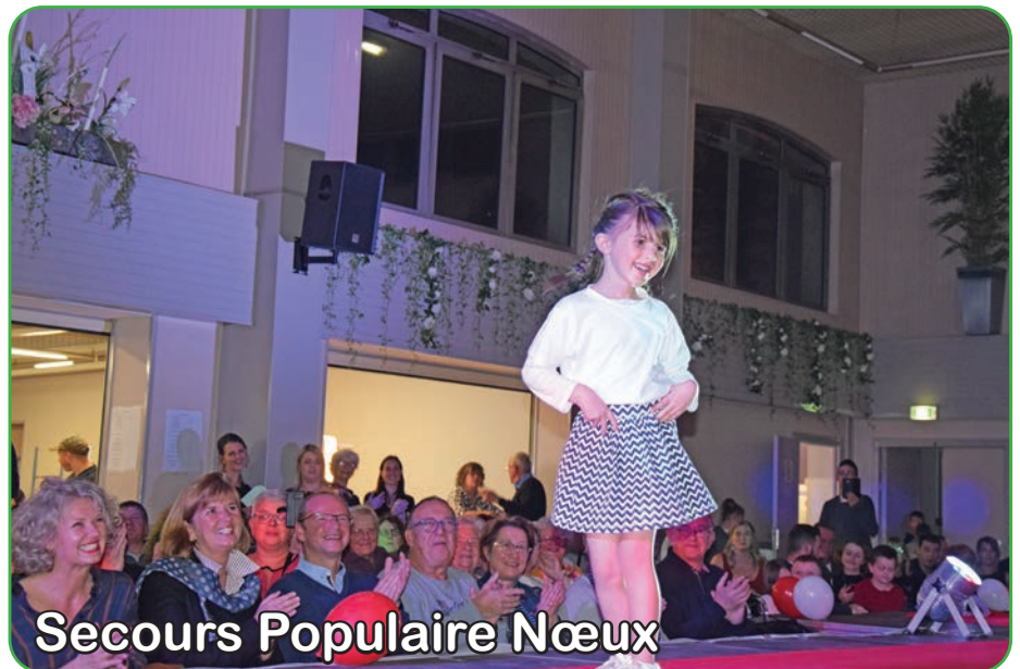
Secours Populaire Nœux

Pour ce faire, 60 mannequins amateurs, âgés de 6 à 60 ans, se sont mis en scène devant un public conquis par leur prestation.