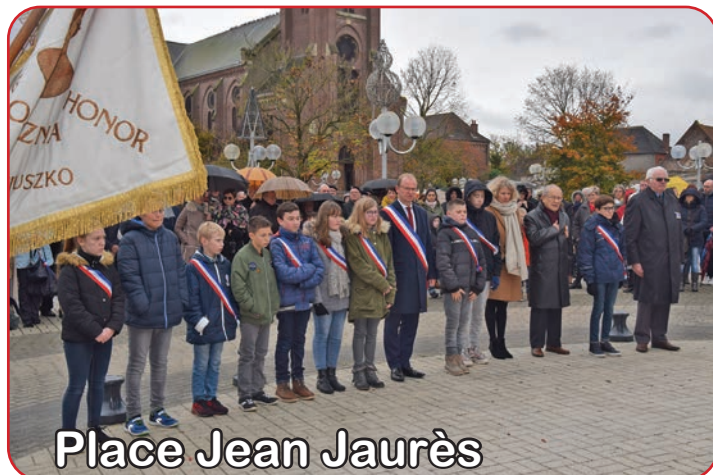
Place Jean Jaurès

Même si le défilé a dû être annulé pour cause de forte pluie, le recueillement était unanime devant les différents monuments aux morts de la ville, lors des cérémonies du 11 Novembre.