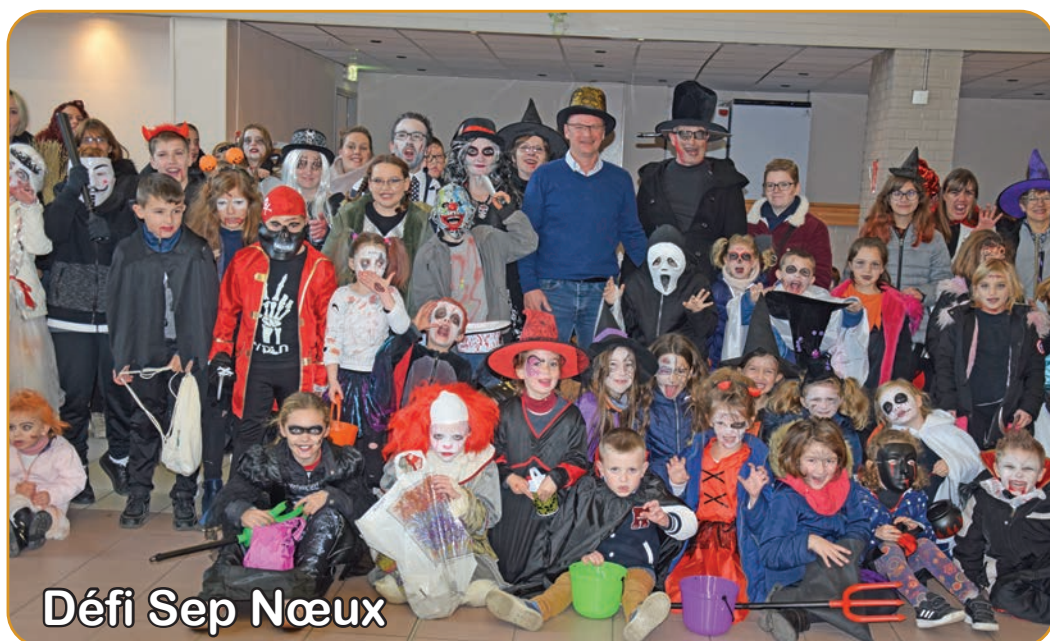
Défi Sep Nœux

Emmenés par l'association Défi Sep Nœux, les gentils monstres, sorcières, zombies et autres Dracula ont été reçus par la municipalité qui leur a distribué des bonbons.