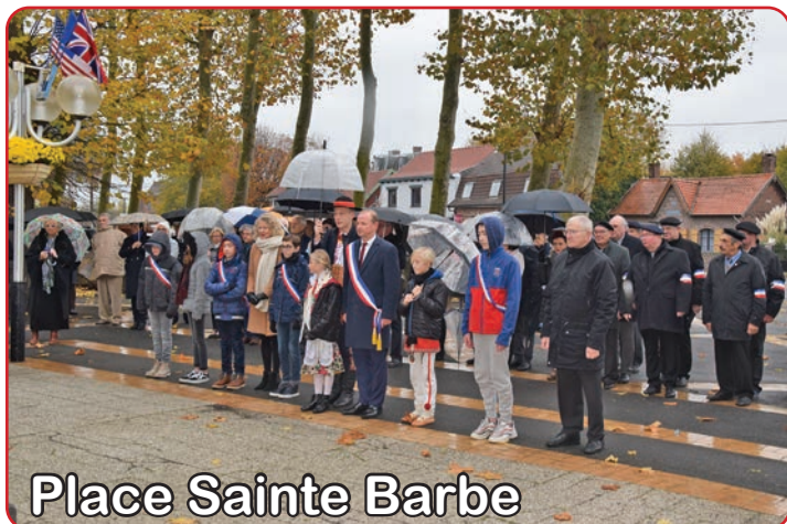
Place Sainte Barbe