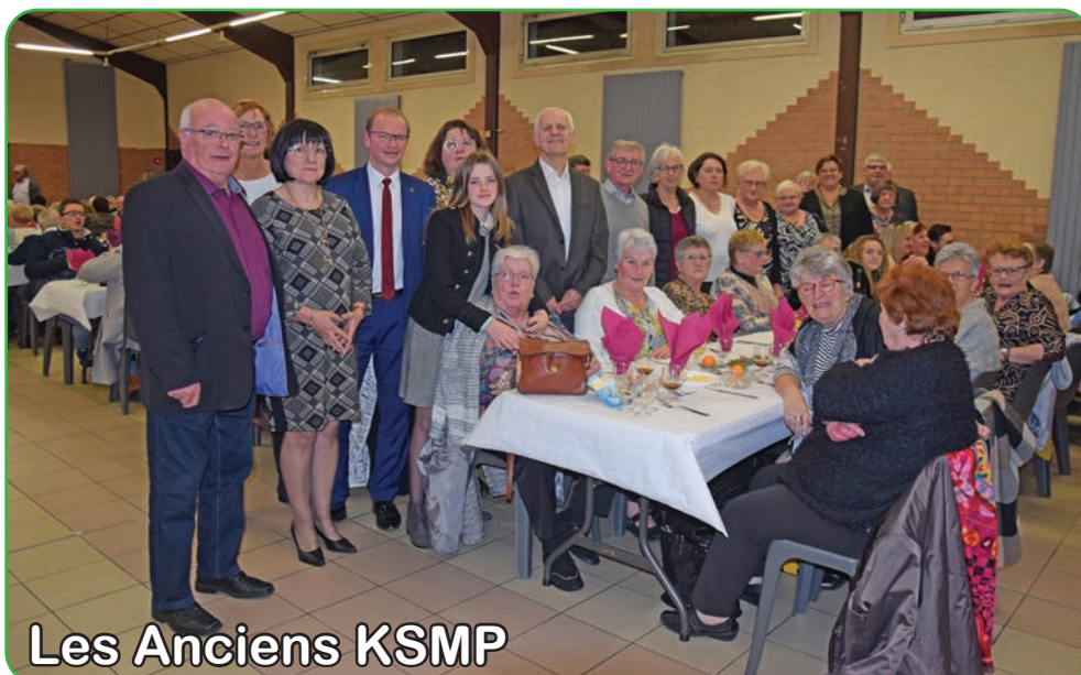
Les Anciens KSMP

Tradition oblige, les Anciens KSMP ont fêté l'arrivée du Beaujolais Nouveau en organisant une soirée dansante.