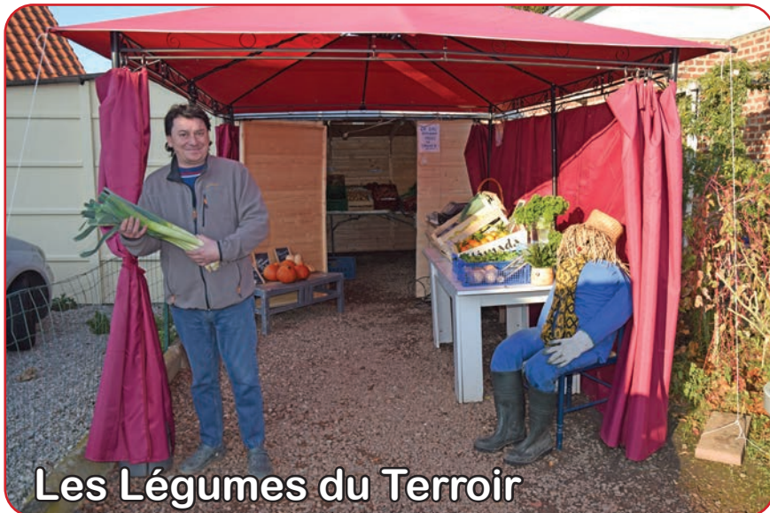
Les Légumes du Terroir