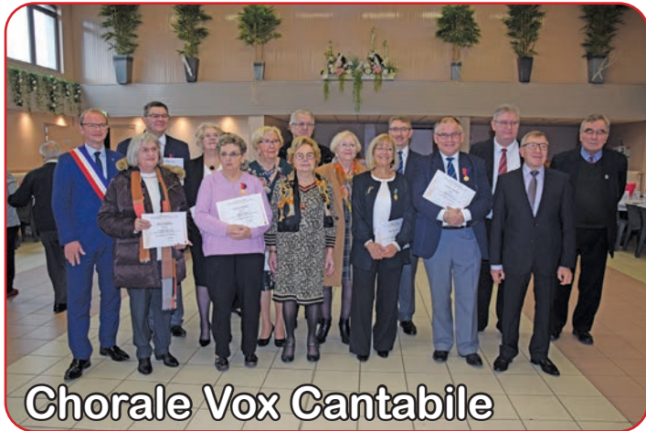
Chorale Vox Cantabile