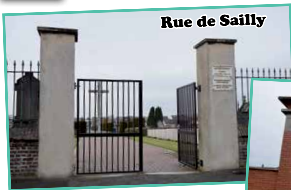
Rue de Sailly