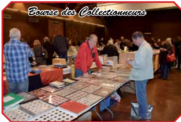
Bourse des Collectionneurs