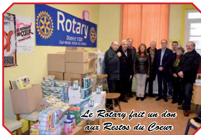
Le Rotary fait un don aux Restos du Coeur