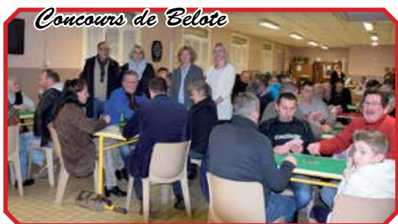
Concours de Belote

Avant son traditionnel Tournoi de Pentecôte, les 14, 15 et 16 mai prochains, le Sporting Club Noeuxois a organisé un concours de belote, qui a réuni 80 férus du carton.