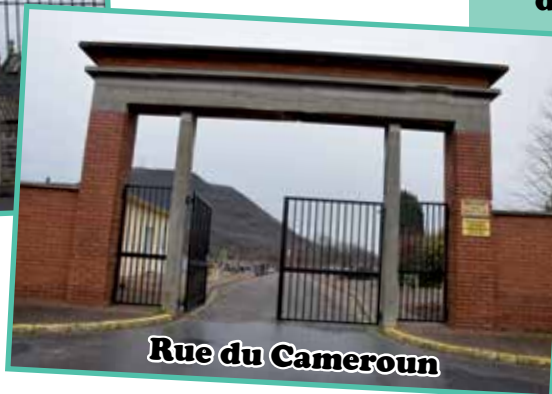
Rue du Cameroun

1. De nouveaux portails ont été installés aux entrées des 2 cimetières de la Ville, rue du Cameroun, rue de l'Égalité et rue de Sailly, soit 5 portails.