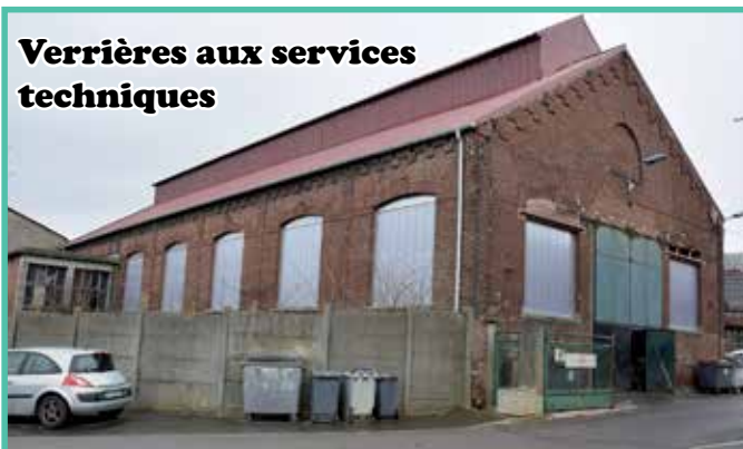
Verrières aux services techniques

3. 15 verrières ont été posées sur le bâtiment des Services Techniques, rue de Béthune.