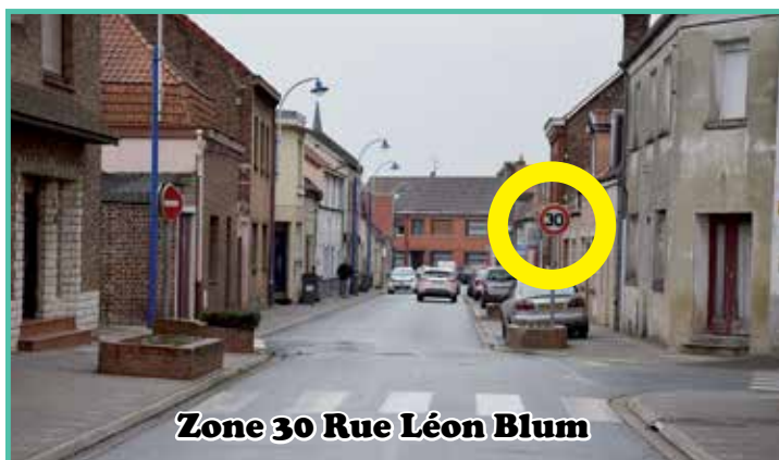
Zone 30 Rue Léon Blum

Posés par l'entreprise Fer Art de Béthune, le coût de cette opération s'élève à 15 537 €.