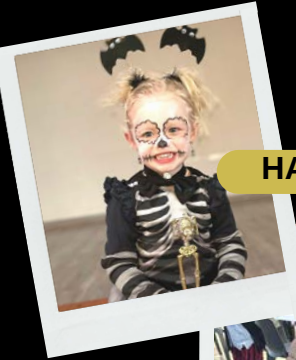
HALLOWEEN CONSEIL CITOYEN