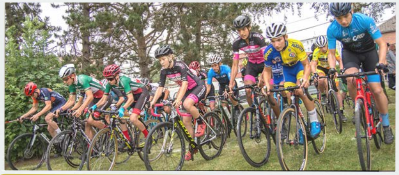
CHALLENGE INTERCOMMUNAL DE CYCLO-CROSS AVEC LE VÉLO-CLUB