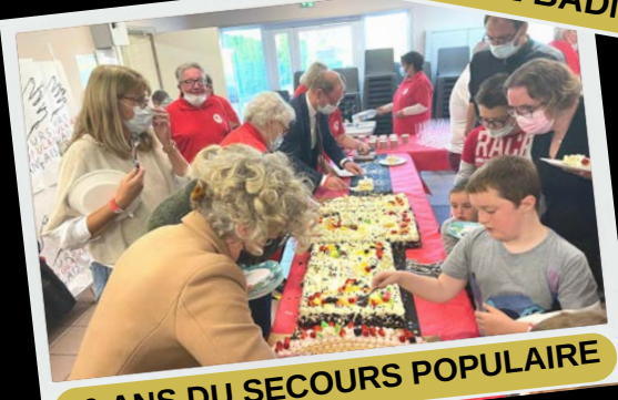
20 ANS DU SECOURS POPULAIRE