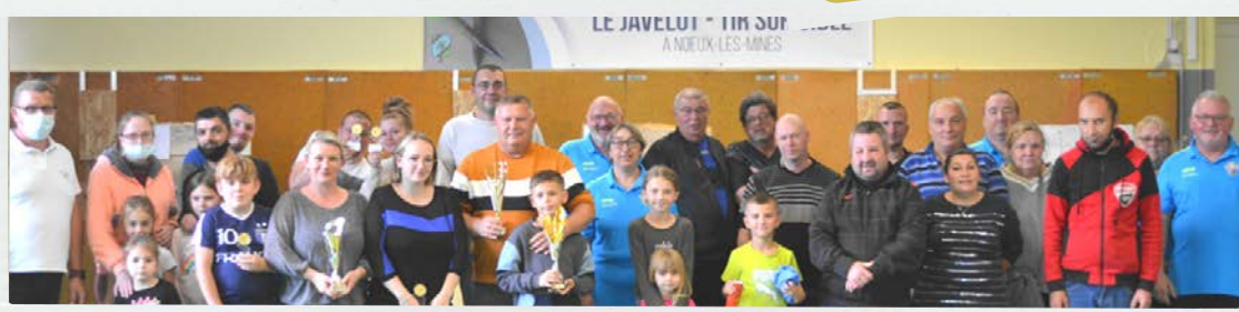
LA PLUME NŒUXOISE