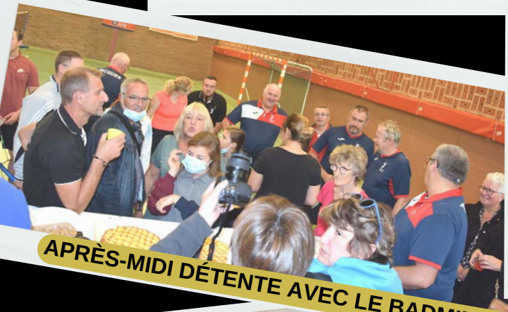
APRÈS-MIDI DÉTENTE AVEC LE BADMINTON