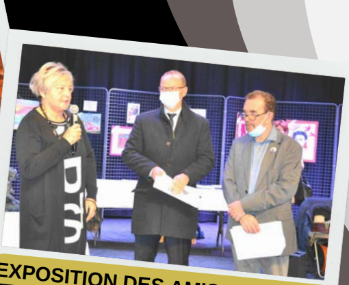
EXPOSITION DES AMIS DES ARTS