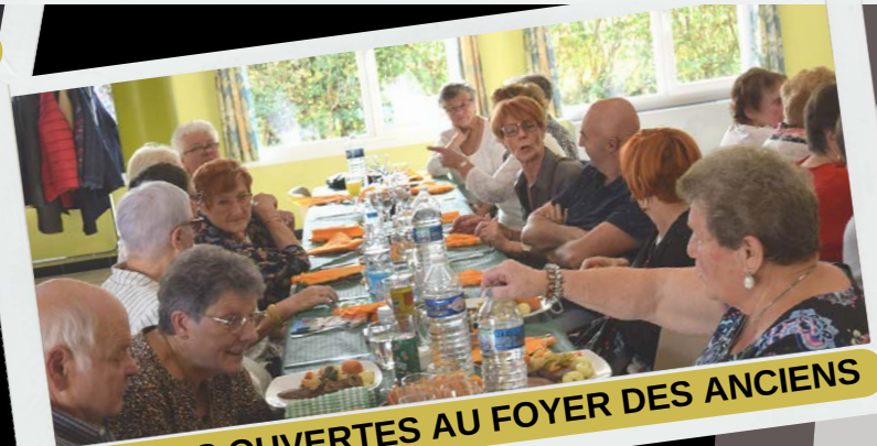
PORTES OUVERTES AU FOYER DES ANCIENS