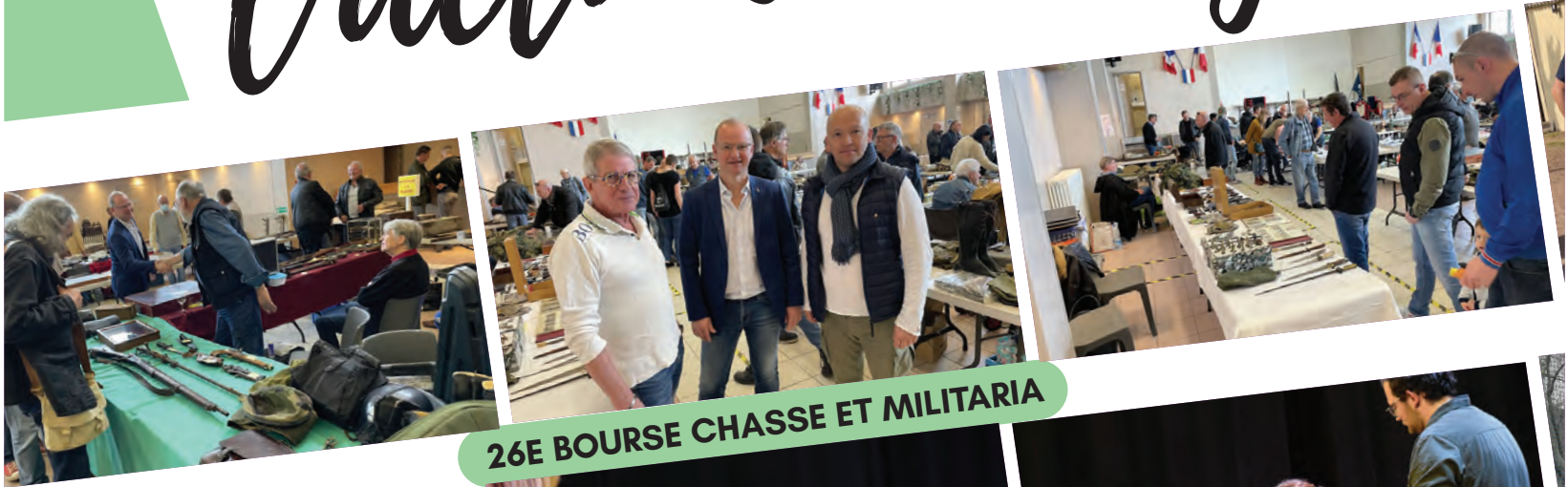
26E BOURSE CHASSE ET MILITARIA