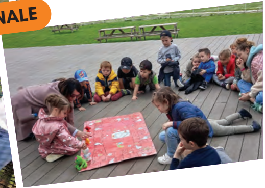
CENTRE DE LOISIRS PÂQUES