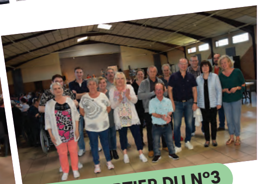
LOTO DU COMITÉ D'ANIMATION DU QUARTIER DU N°3

de Nœux-les-Mines ou suivez nous sur Flick pseudo : noeux_les_mines