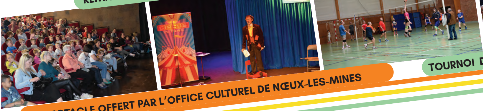
SPECTACLE OFFERT PAR L'OFFICE CULTUREL DE NŒUX-LES-MINES