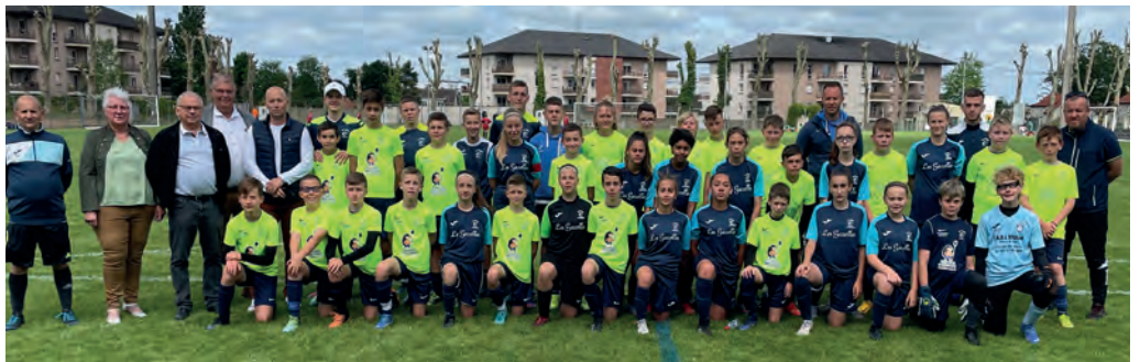
35 Nœuxois et Nœuxoises répartis en équipes garçons et en une formation féminine, appelée Les Gazelles, ont défendu les couleurs de l'USN.