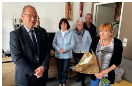
Les élus avec des locataires ravis.

Avec les 9,5 M€ à la cité Agniel et les 2,8 M€ l'opération à La Croix Ricart, ce sont 12,3 M€ qui ont été investis sur le territoire de Nœux-les-Mines, suite à l'action municipale.