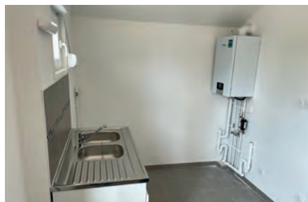
La pose de nouvelles chaudières.