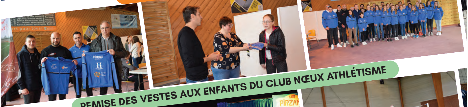
REMISE DES VESTES AUX ENFANTS DU CLUB NŒUX ATHLÉTISME