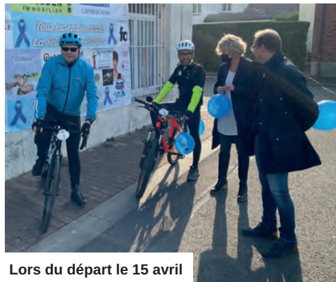
Lors du départ le 15 avril