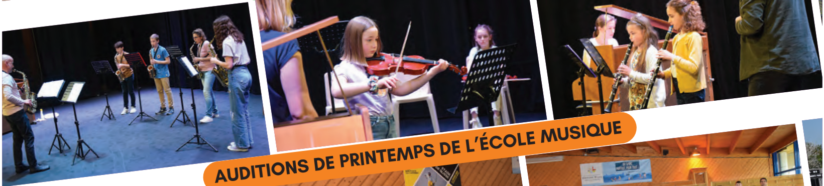
AUDITIONS DE PRINTEMPS DE L'ÉCOLE MUSIQUE