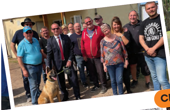
CLUB DE CHIENS D'UTILITÉ NATIONALE