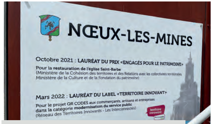
Une plaque précisant les derniers labels décrochés par la Ville a été installée à l'entrée de la mairie.