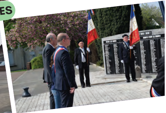
SOUVENIR DES DÉPORTÉS