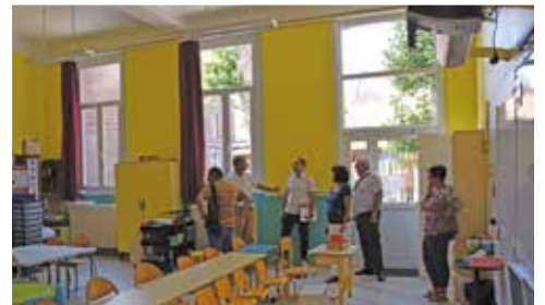
La classe n°3 de l'école Saint-Exupéry refaite totalement : 23 976 € TTC