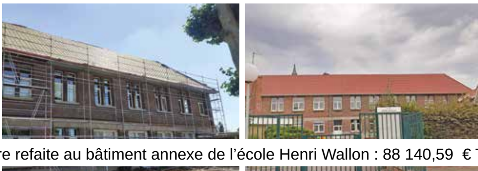
Toiture refaite au bâtiment annexe de l'école Henri Wallon : 88 140,59 € TTC.