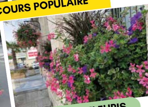
PASSAGE DU JURY DES VILLES ET VILLAGES FLEURIS