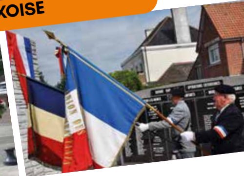
DÉPÔT DE GERBES DU 14 JUILLET