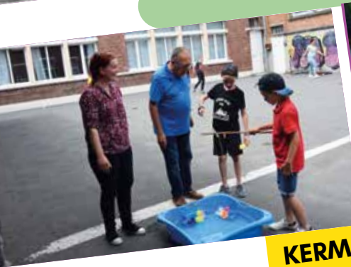
KERMESSES ÉCOLES PERGAUD ET WALLON