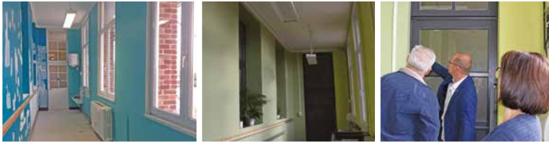
Plusieurs rénovations de peintures à l'école Suzanne Blin.