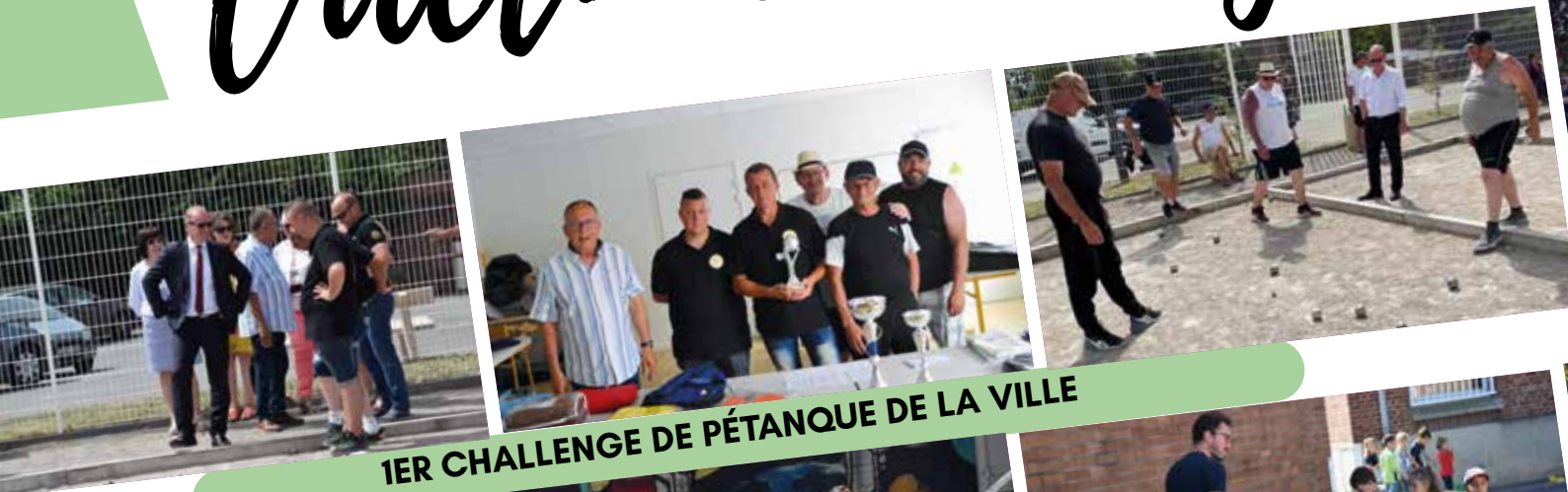
1 ER CHALLENGE DE PÉTANQUE DE LA VILLE