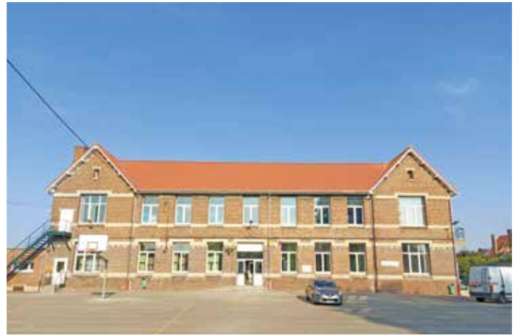
Rénovation de la toiture de l'école Suzanne Blin : 105 373,51 € TTC