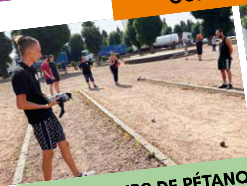
CONCOURS DE PÉTANQUE FUTSAL CLUB NŒUXOIS