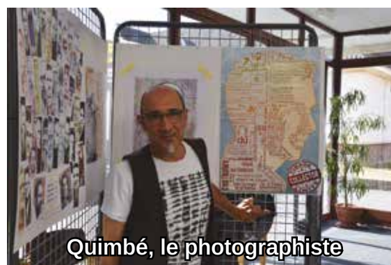
Quimbé, le photographe