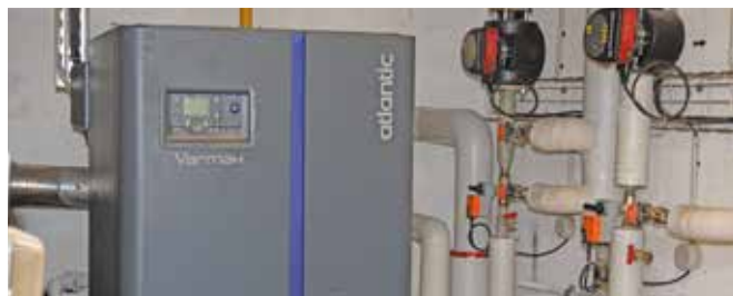
Travaux de réfection ainsi que le changement du système de production d'eau chaude à la crèche.