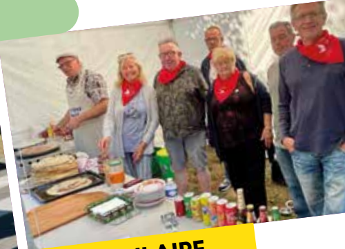
MARCHÉ AUX PUCES DE TERRE NOËVE ET DU SECOURS POPULAIRE