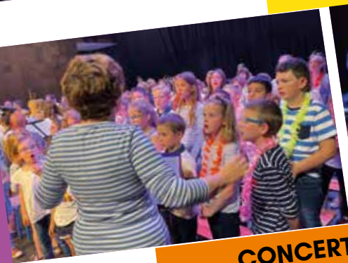
CONCERT DE FIN D'ANNÉE DE L'ÉCOLE DE MUSIQUE