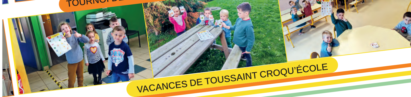
VACANCES DE TOUSSAINT CROQU'ÉCOLE

ou suivez nous sur Flick pseudo : noeux_les_mines