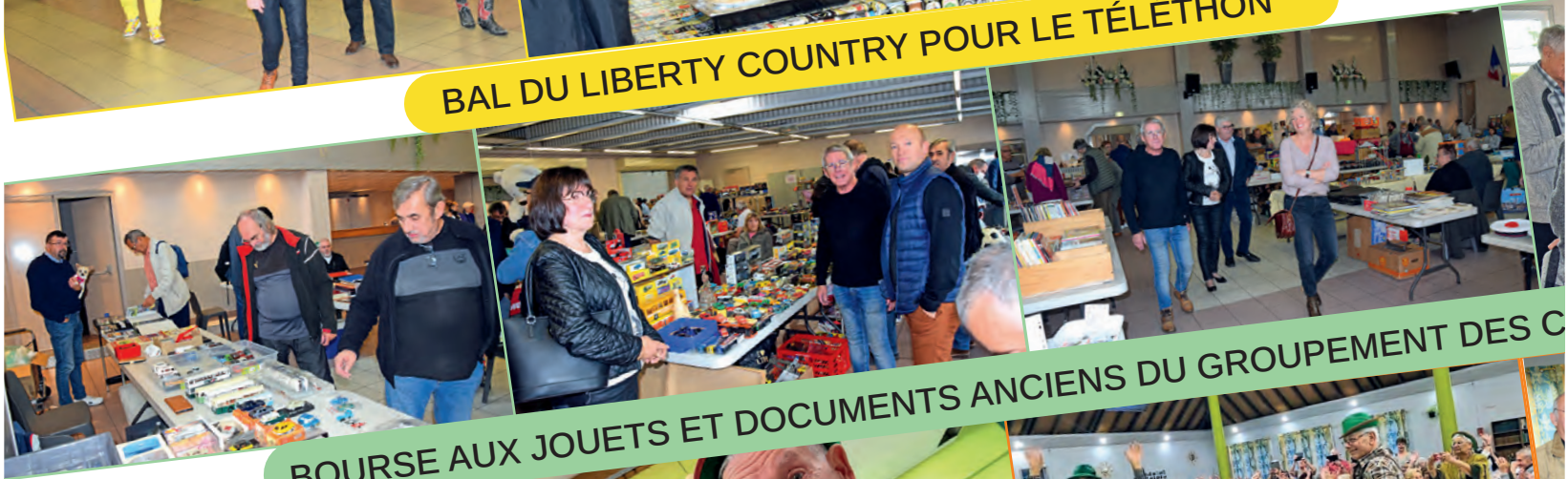
BOURSE AUX JOUETS ET DOCUMENTS ANCIENS DU GROUPEMENT DES C