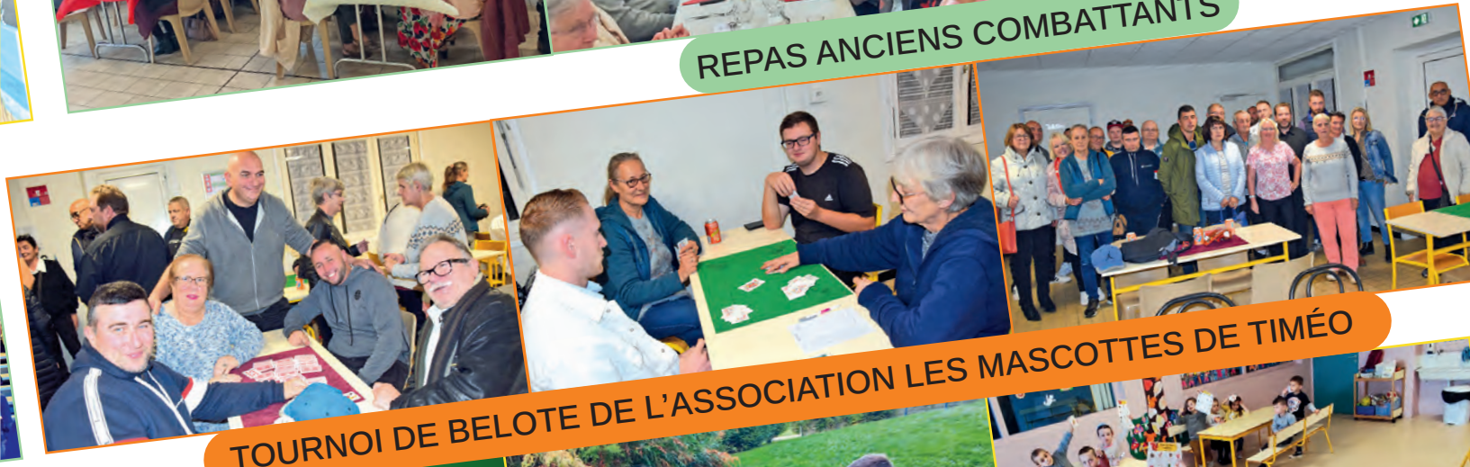
TOURNOI DE BELOTE DE L'ASSOCIATION LES MASCOTTES DE TIMÉO