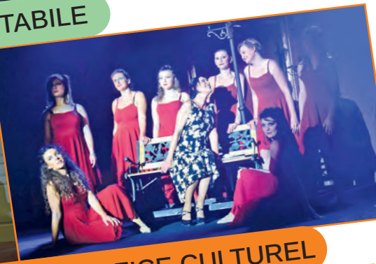
CABARET ORGANISÉE PAR OFFICE CULTUREL