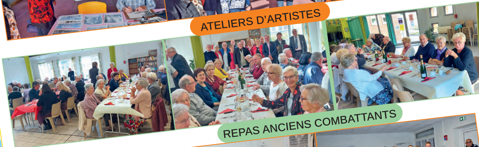
REPAS ANCIENS COMBATTANTS