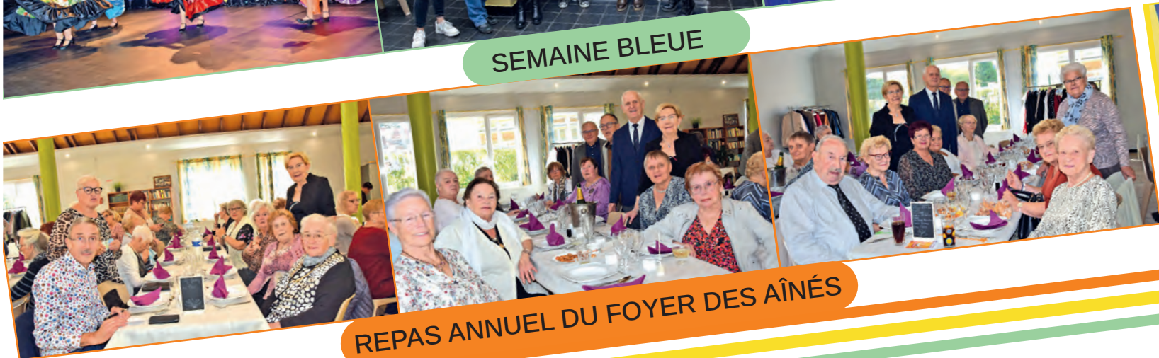
REPAS ANNUEL DU FOYER DES AÎNÉS