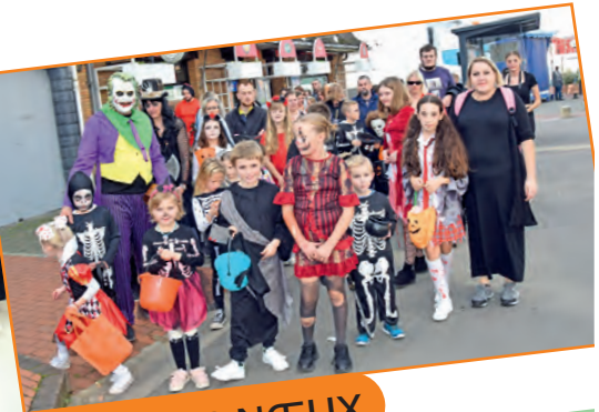
HALLOWEEN DÉFI SEP NŒUX