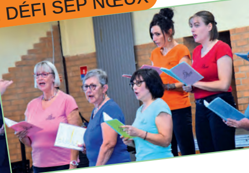
FESTIVAL CHORAL VOX CANTABILE