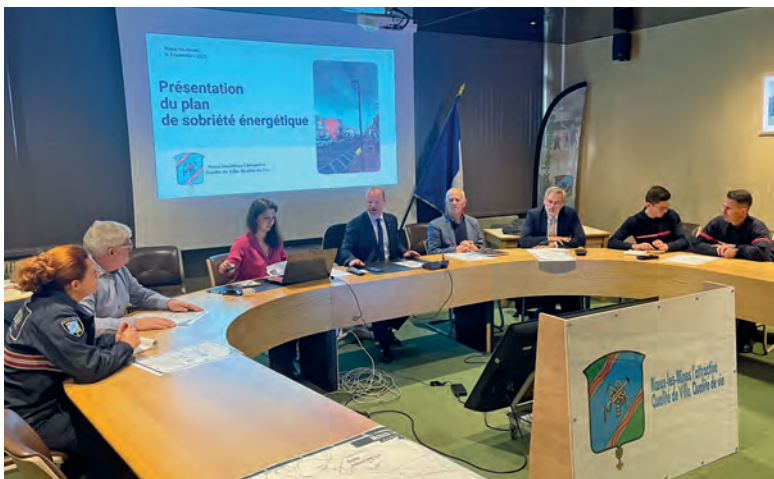
Lors de la présentation du plan aux forces de sécurité.

Selon un rapport de la très sérieuse Fédération Départementale de l'énergie, « l'augmentation de la facture de l'électricité pourrait atteindre jusqu'à 600 % ». « Si nous ne faisons rien, la Ville va voir sa facture énergétique augmenter de 800 000€ ! Nous ne pouvons pas laisser une dette financière et climatique à nos enfants. Nous devons donc agir », a déclaré le Maire.