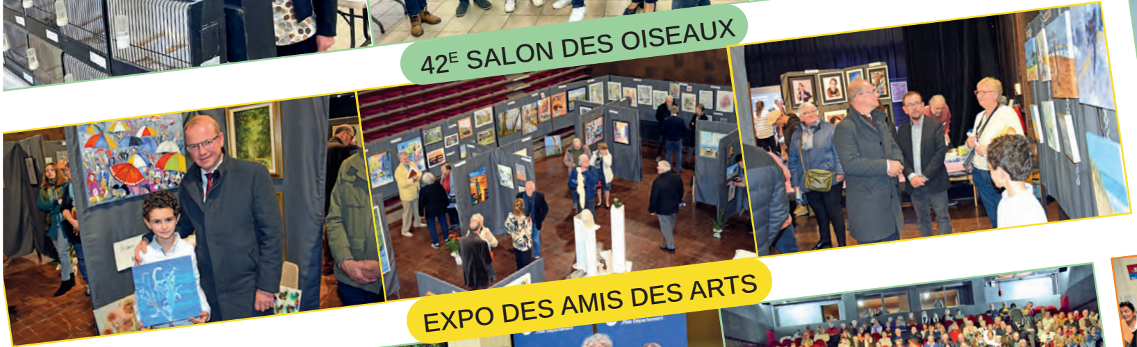
EXPO DES AMIS DES ARTS