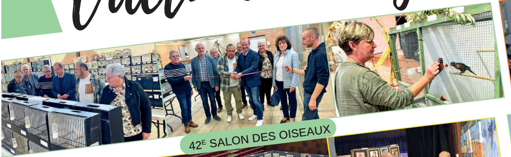
42 E SALON DES OISEAUX