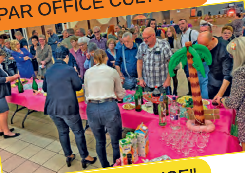
REPAS ANNUEL "LA BOULE JOYEUSE"

ou suivez nous sur Flick pseudo : noeux_les_mines