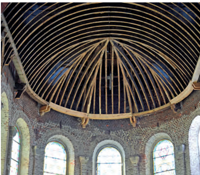
Réfection des supports de la voûte du chœur de l'édifice religieux.