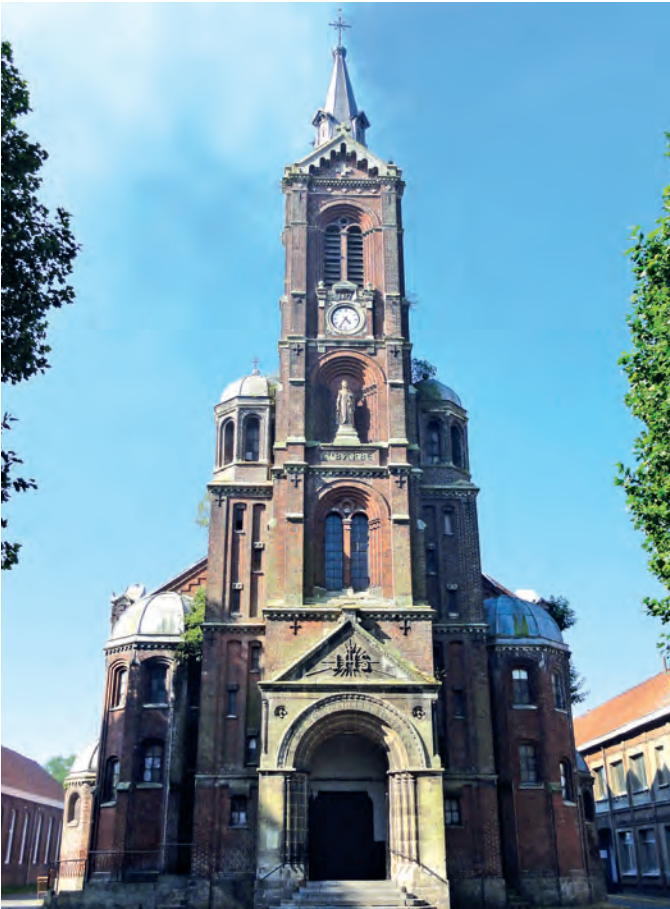
La façade de l'église Sainte-Barbe avant le début des travaux de rénovation.

Le samedi 17 septembre, l'église Sainte-Barbe située en haut de Nœux-les-Mines a ouvert exceptionnellement ses portes dans le cadre des Journées Européennes du Patrimoine. L'occasion de faire un point sur les travaux de restauration.