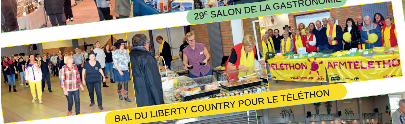
BAL DU LIBERTY COUNTRY POUR LE TÉLÉTHON