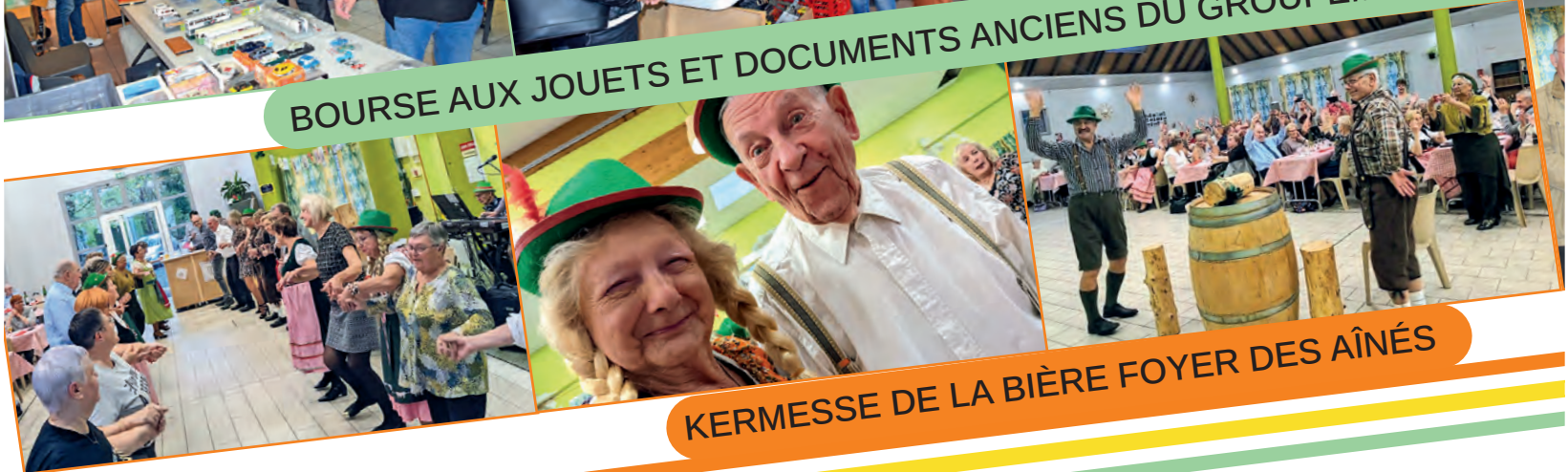
KERMESSE DE LA BIÈRE FOYER DES ÂÎNÉS

Découvrez notre Galerie Photo sur l'appli de Nœux-les-Mines