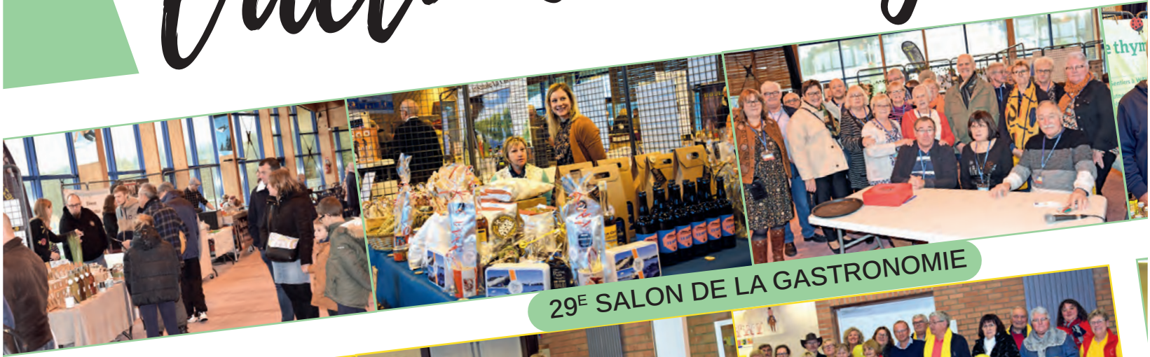
29 E SALON DE LA GASTRONOMIE