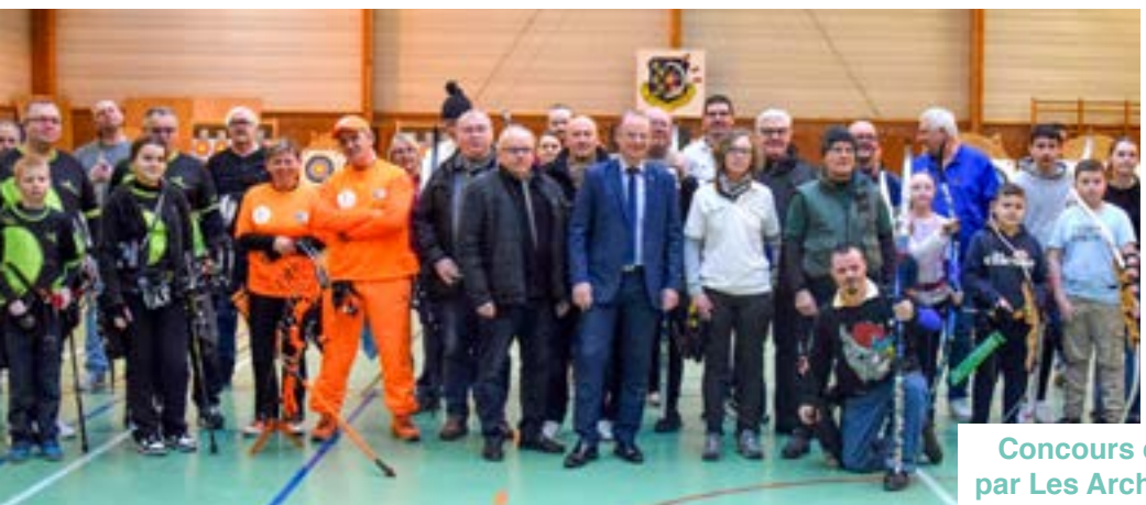
Concours de tir à l'arc par Les Archers Nœuxois