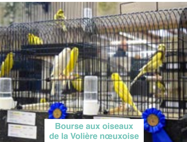
Bourse aux oiseaux de la Volière nœuxoise