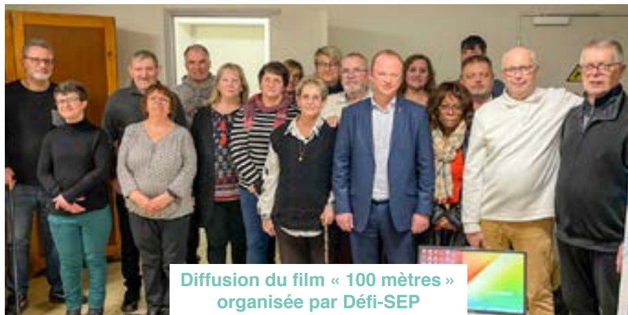
Diffusion du film « 100 mètres » organisée par Défi-SEP