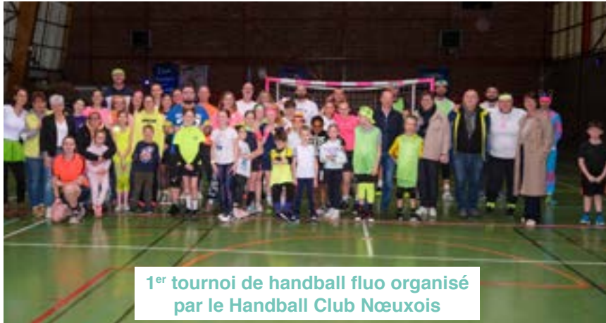
1 er tournoi de handball fluo organisé par le Handball Club Nœuxois