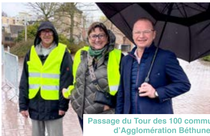
Passage du Tour des 100 communes organisé par la Communauté d'Agglomération Béthune-Bruay, Artois-Lys Romane