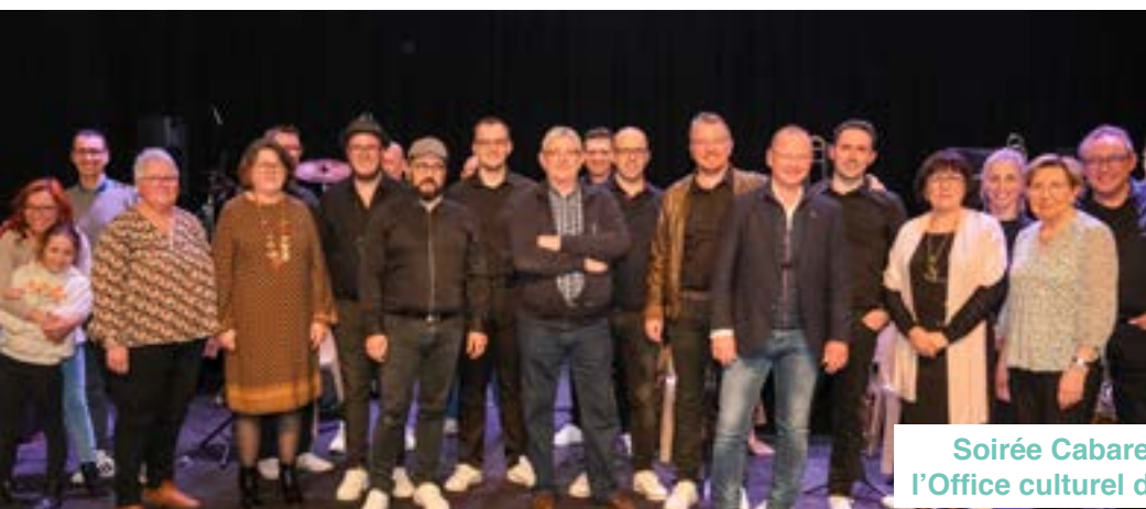
Soirée Cabaret organisée par l'Office culturel de Nœux-les-Mines