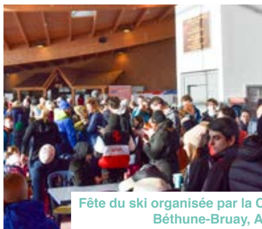
Fête du ski organisée par la Communauté d'Agglomération Béthune-Bruay, Artois-Lys Romane