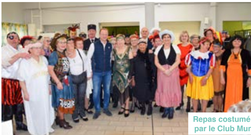
Repas costumé pour Mardi Gras par le Club Municipal des Aînés