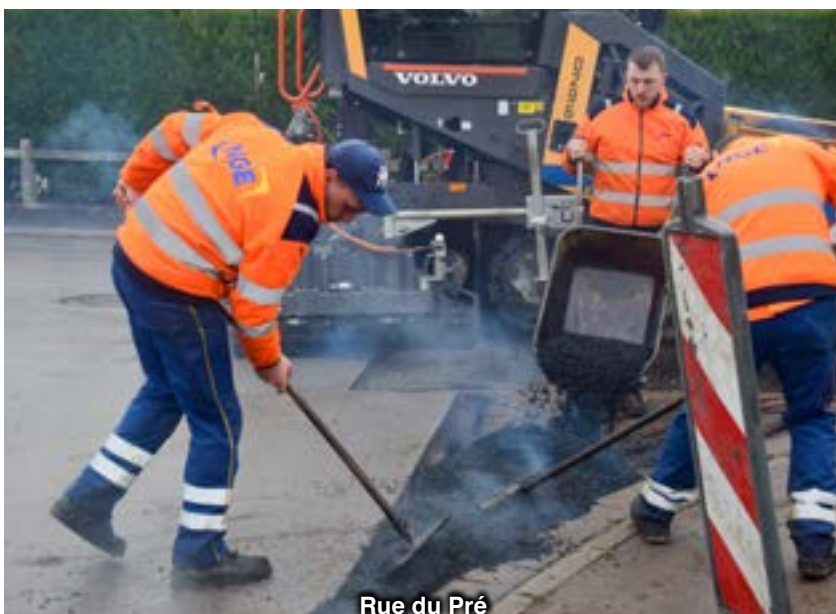
Rue du Pré