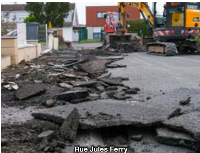
Rue Jules Ferry