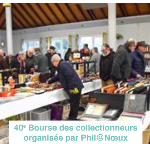
40 e Bourse des collectionneurs organisée par Phil@Nœux