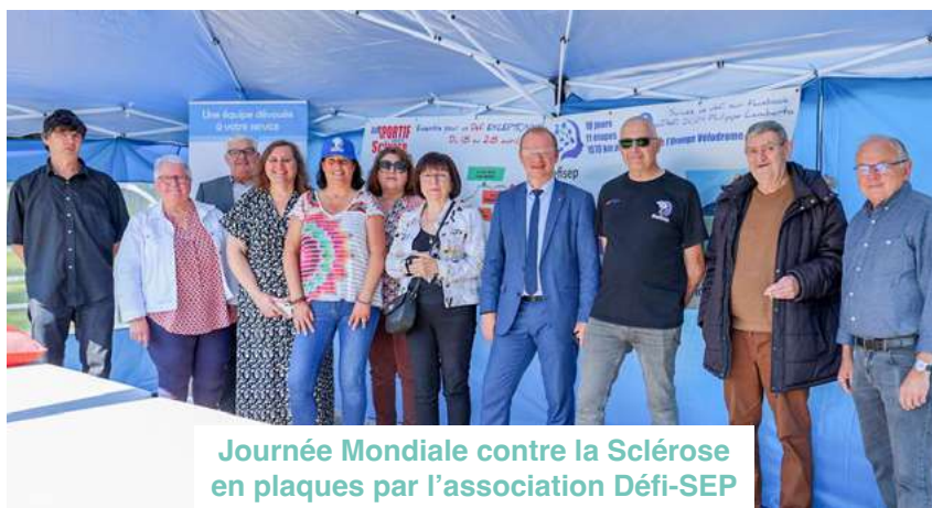
Journée Mondiale contre la Sclérose en plaques par l'association Défi-SEP