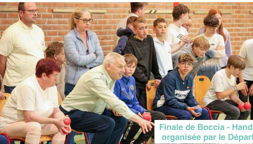
Finale de Boccia - Handisport intergénérationnel organisée par le Département du Pas-de-Calais