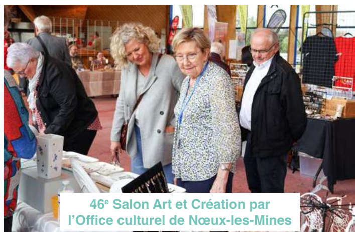
46 e Salon Art et Création par l'Office culturel de Nœux-les-Mines