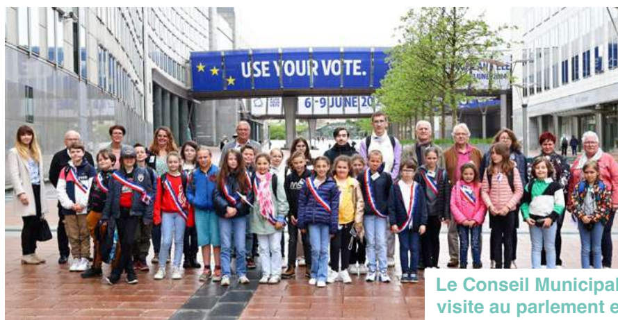
Le Conseil Municipal des Jeunes (CMJ) en visite au parlement européen de Bruxelles