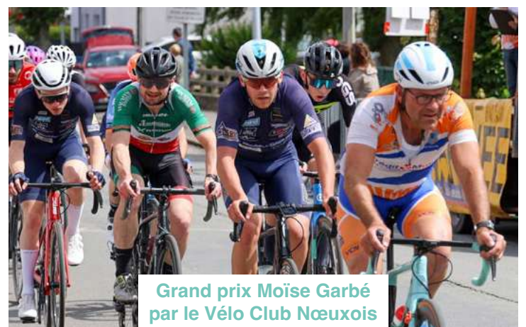
Grand prix Moïse Garbé par le Vélo Club Nœuxois