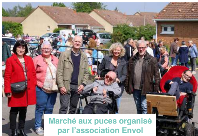
Marché aux puces organisé par l'association Envol