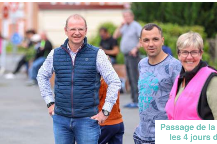
Passage de la course cycliste les 4 jours de Dunkerque