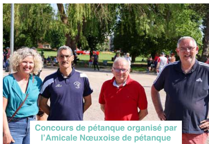
Concours de pétanque organisé par l'Amicale Nœuxoise de pétanque