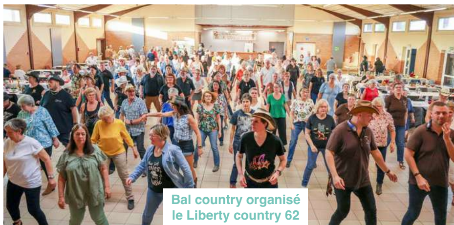
Bal country organisé le Liberty country 62