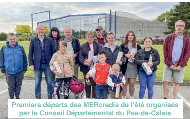
Premiers départs des MERcredis de l'été organisés par le Conseil Départemental du Pas-de-Calais