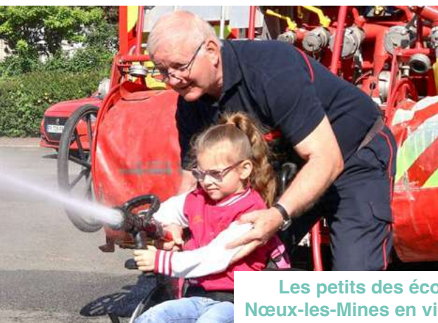
Les petits des écoles maternelles de Nœux-les-Mines en visite chez les pompiers