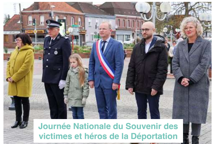
Journée Nationale du Souvenir des victimes et héros de la Déportation