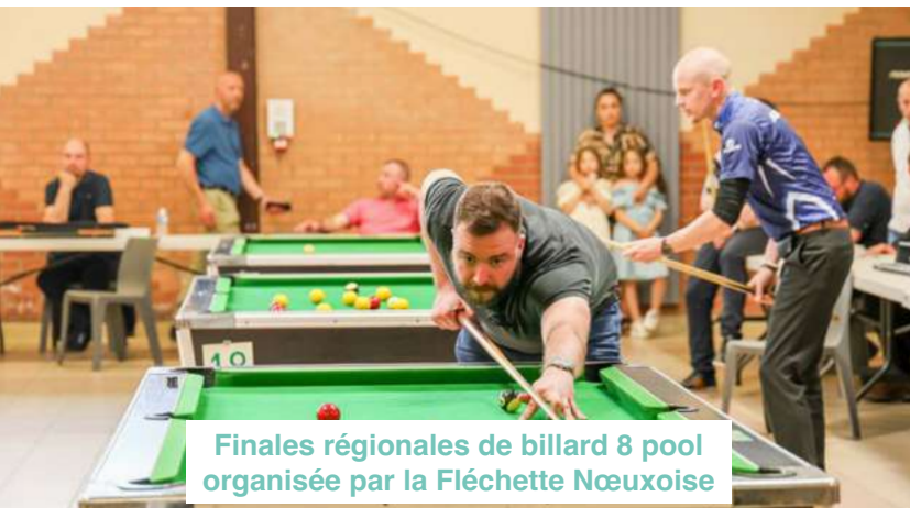
Finales régionales de billard 8 pool organisée par la Fléchette Nœuxoise