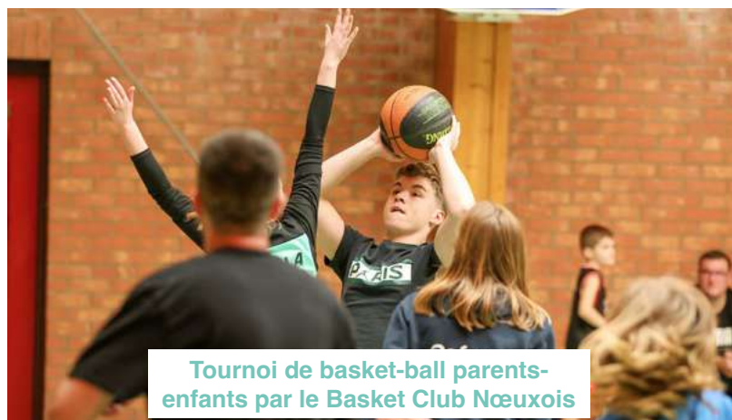
Tournoi de basket-ball parents-enfants par le Basket Club Nœuxois