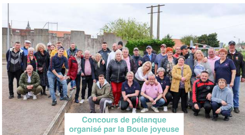
Concours de pétanque organisé par la Boule joyeuse