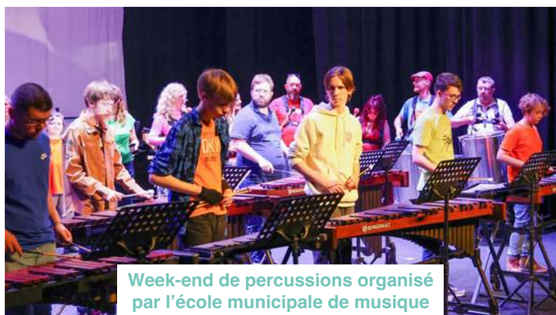
Week-end de percussions organisé par l'école municipale de musique