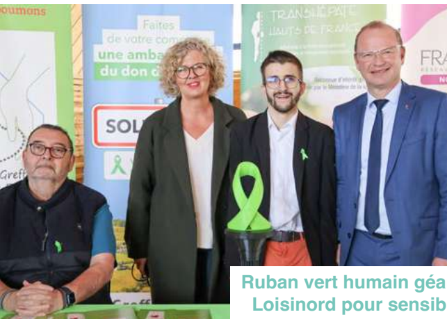
Ruban vert humain géant au Stade de Glisse de Loisinord pour sensibiliser au don d'organes