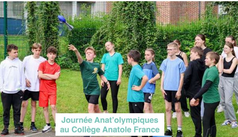
Journée Anat'olympiques au Collège Anatole France