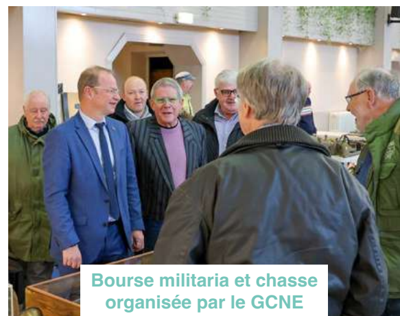
Bourse militaria et chasse organisée par le GCNE