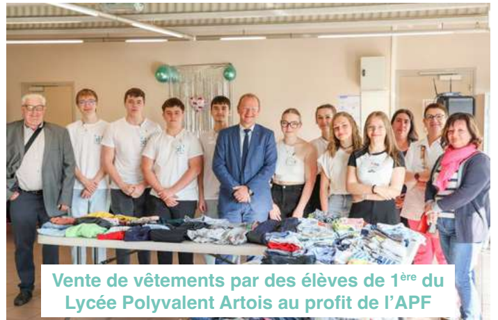
Vente de vêtements par des élèves de 1 ère du Lycée Polyvalent Artois au profit de l'APF