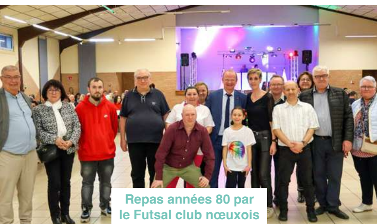
Repas années 80 par le Futsal club nœuxois