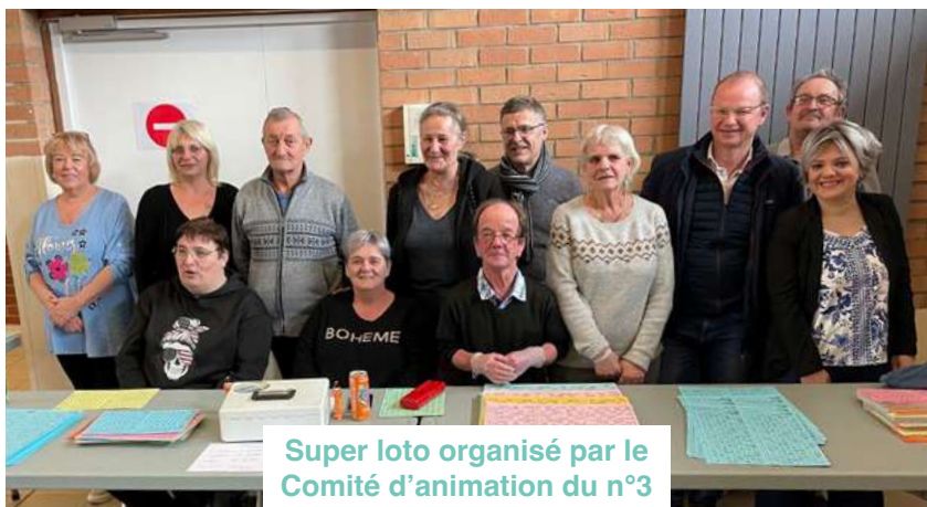
Super loto organisé par le Comité d'animation du n°3