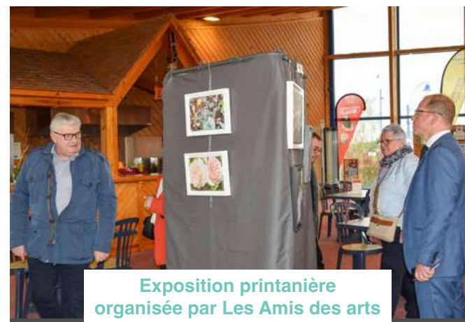
Exposition printanière organisée par Les Amis des arts