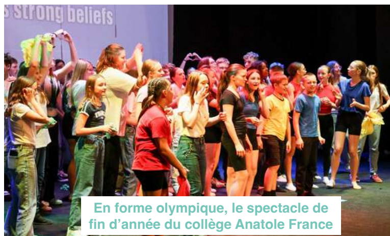
En forme olympique, le spectacle de fin d'année du collège Anatole France