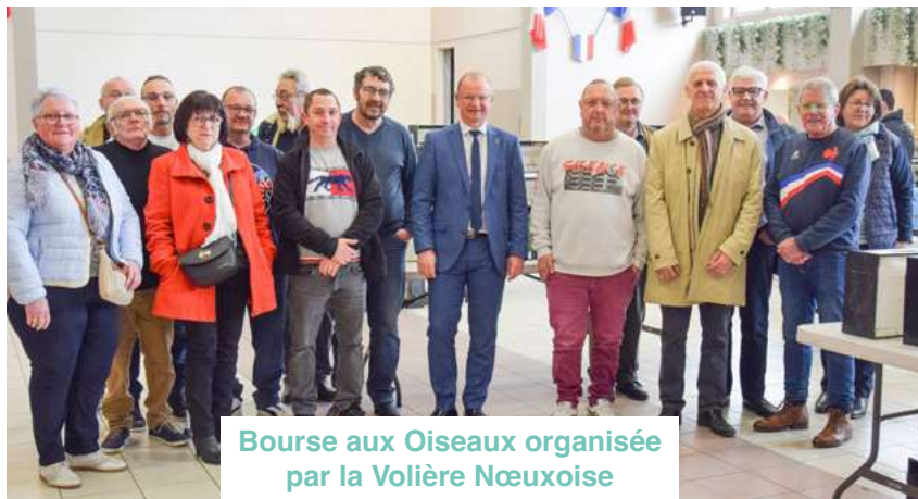
Bourse aux Oiseaux organisée par la Volière Nœuxoise