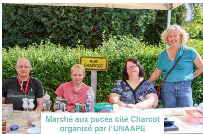
Marché aux puces cité Charcot organisé par l'UNAAPE