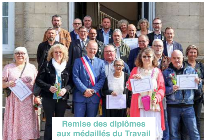
Remise des diplômes aux médaillés du Travail