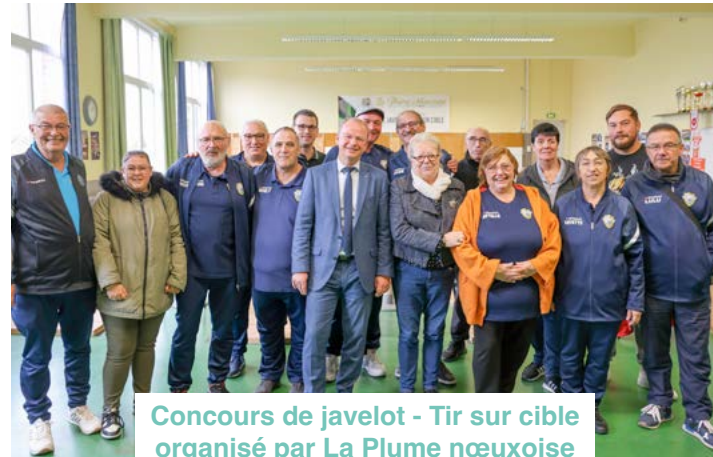
Concours de javelot - Tir sur cible organisé par La Plume nœuxoise