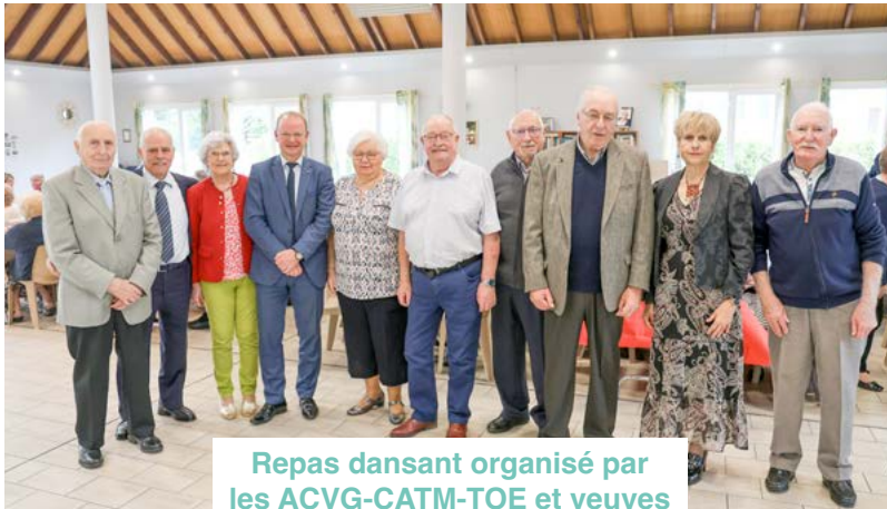
Repas dansant organisé par les ACVG-CATM-TOE et veuves