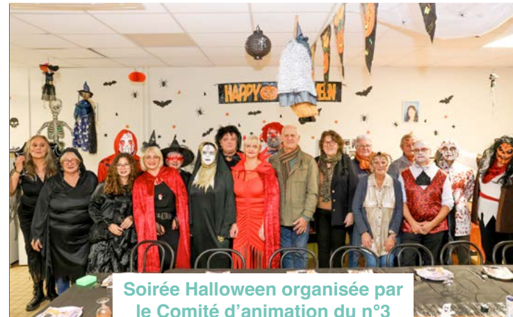
Soirée Halloween organisée par le Comité d'animation du n°3