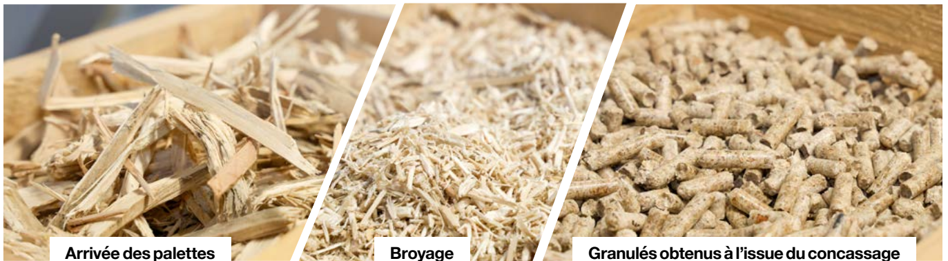
Arrivée des palettes