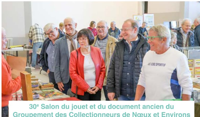
30 e Salon du jouet et du document ancien du Groupement des Collectionneurs de Nœux et Environs