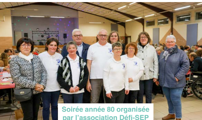
Soirée année 80 organisée par l'association Défi-SEP