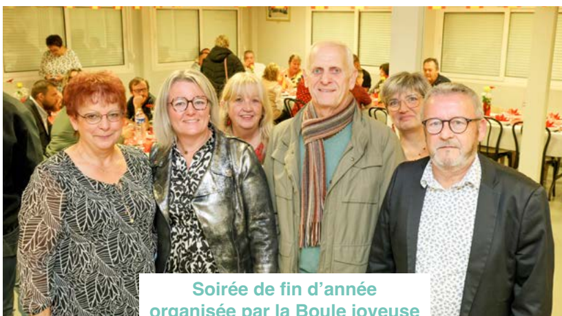
Soirée de fin d'année organisée par la Boule joyeuse