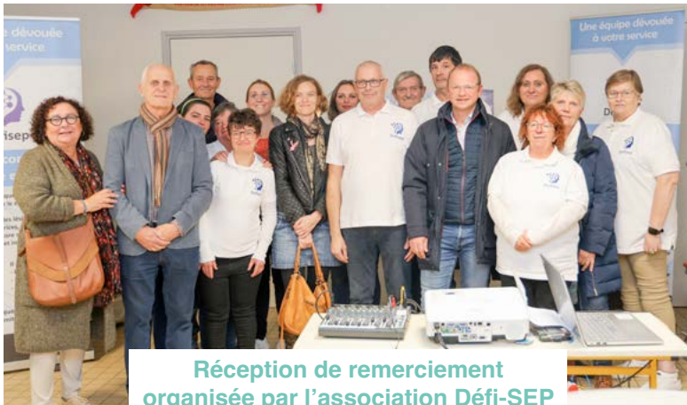
Réception de remerciement organisée par l'association Défi-SEP