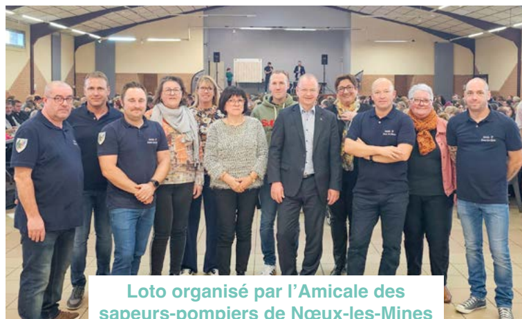
Loto organisé par l'Amicale des sapeurs-pompiers de Nœux-les-Mines