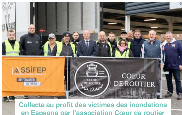
Collecte au profit des victimes des inondations en Espagne par l'association Cœur de routier