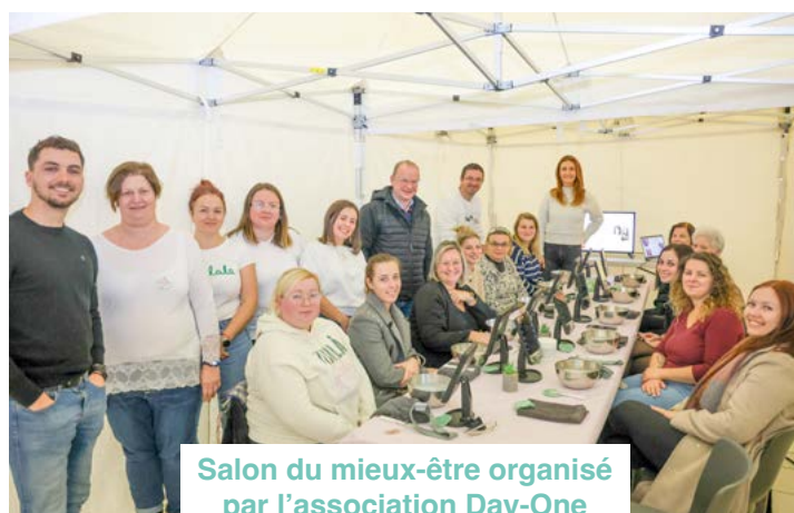
Salon du mieux-être organisé par l'association Day-One