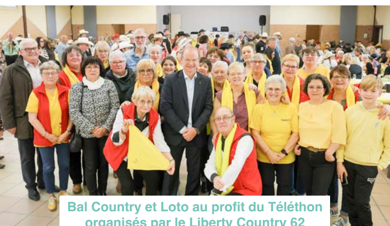
Bal Country et Loto au profit du Téléthon organisés par le Liberty Country 62