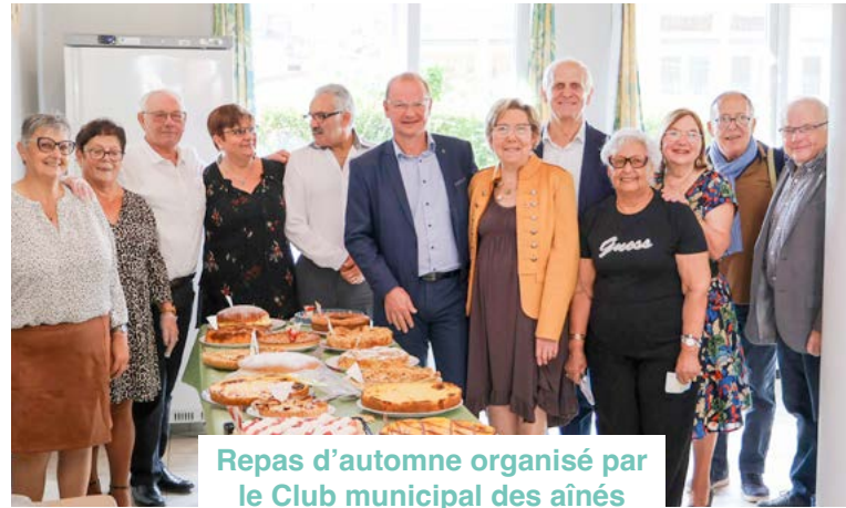
Repas d'automne organisé par le Club municipal des aînés