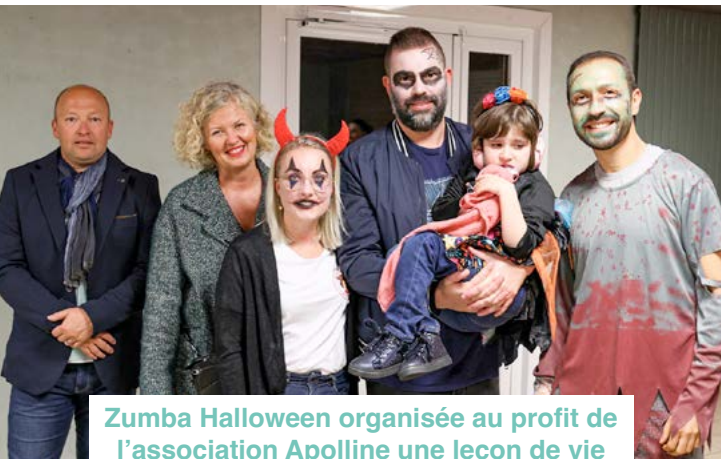
Zumba Halloween organisée au profit de l'association Apolline une leçon de vie