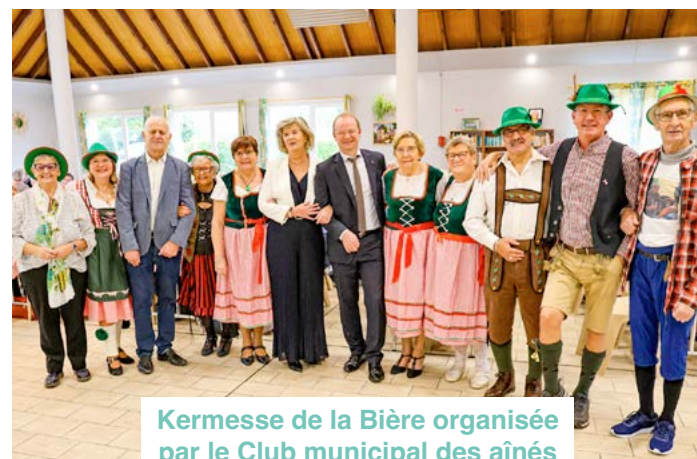
Kermesse de la Bière organisée par le Club municipal des aînés