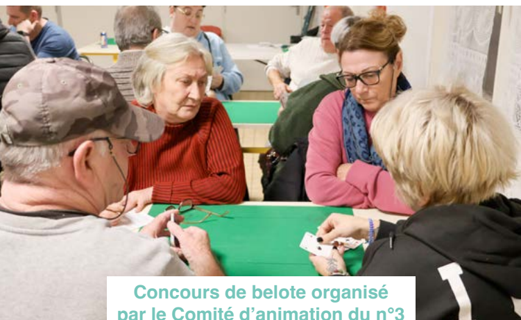
Concours de belote organisé par le Comité d'animation du n°3