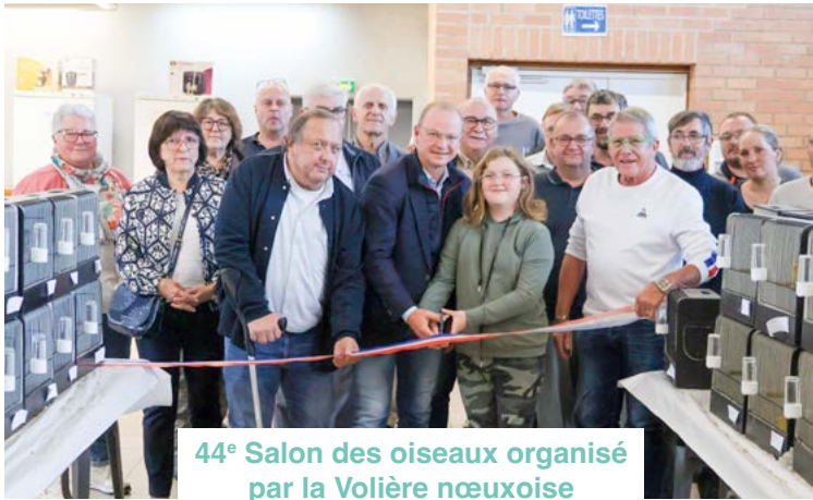
44 e Salon des oiseaux organisé par la Volière nœuxoise